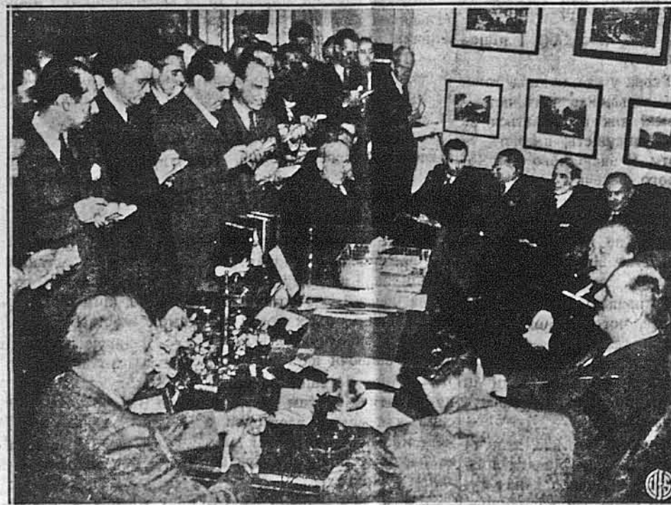
ЧОРЧИЛ У БІЛОМУ ДОМІ. Так виглядала остання пресова конференція в Вашингтоні, на котрій попри президента Рузвельта був приваний ще й британський прем'єр Чорчил. (Президента пізнали по довгій цигоринці; Чорчил сидить за ним, курячи грубе цигаро). Чорчил заявив, що надії на заломання наїстів із середини нема та що їх треба вперед перемотти війною.

Совети повели один загальний наступ на лінії від Ленінграду до Харкова. В декількох місцях вони досягнули нові успіхи. Але, назагал, німецький опір, зокрема на центральному фронті біля Москви, кріпшає. Советські війська стараються відбити Орел. На кримському фронті, говорять советські звідомлення, советська залога в Севастополі відбила німецькі напади з страшною для них втратою. Там мало згинути 20,000 німецьких вояків. — Німецькі звідомлення говорять, що советські війська на ріжних відтинках советського фронту наступа-ли і були відбиті з втратами.