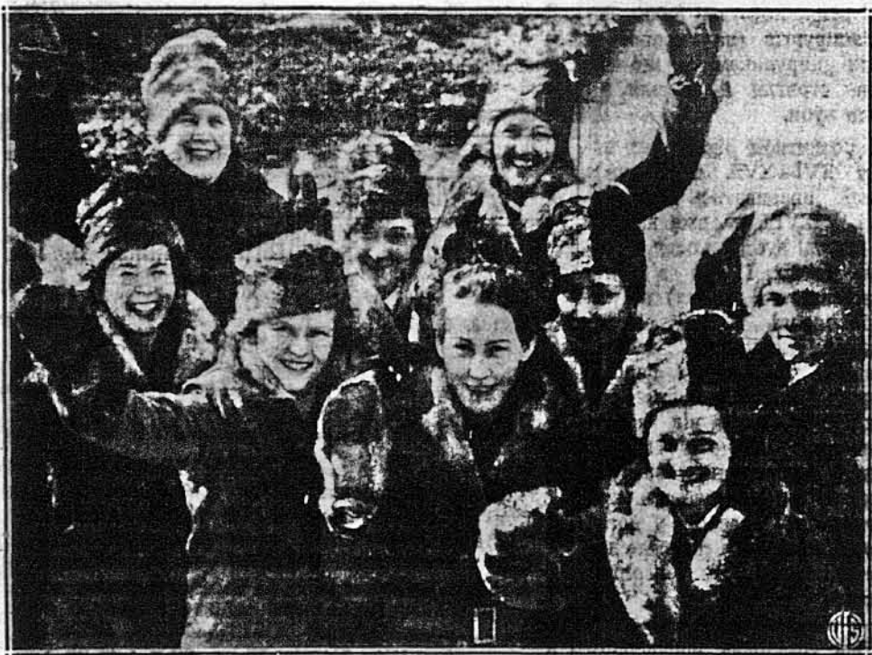
ЧЛЕНИЦІ ЧЕРВОНОГО ХРЕСТА В ІСЛЯНДІ.