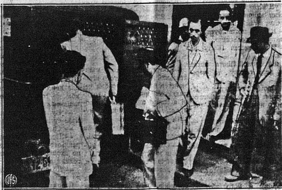
БРАЗИЛІЯ ІНТЕРНУЄ ЧУЖИНЦІВ. Піддані держав Осі вивізжають з центральної поліційної стації в Ріо де Жанейро до концентраційного табору на Іля дас Фьорес, що є неможливі Еліс Айлендом Бразилії. Вони правдоподібно будуть оставати там до закінчення війни.

ЛОНДОН. — Японці при помочи 40 транспортних кораблів висадили в бурмських порті Рангун біля 80,000 війська. В той спосіб вони побільшили своє військо в Бурмі до 150,000. Японці хочуть захопити цілу Бурму, ще заки зачнуть в Бурмі палати ясні дощі. Ті дощі появляються з весною.