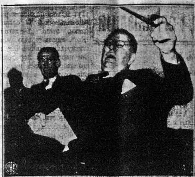
СЕКРЕТАР ФЛОТИ ФРЕНК НАКС на переслуханні перед конгресовим комітетом для флотних справ.

Далі Карусі говорив, що дні розбиття, вагання і небезпечного почуття самотності минули назавжди. Тут, на промисловому фронті, ми куємо зброю, якої наші хлопці на бойовому фронті живають проти ворога. І тут, так само, як і на полі бою, фронт не сміє заломатись. Дні, коли можна було ділити й панувати, неперворотно минули і це буде причиною поразки держав „осі“. Японці і нацисти не передбачали, що громадяни Об'єднаних Держав не дозволять собі ділити, та що цією єдністю