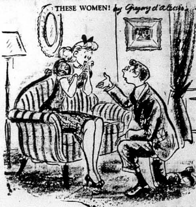
THESE WOMEN! by Gregory d'Alencourt