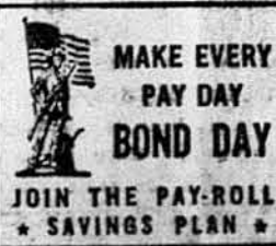
MAKE EVERY PAY DAY BOND DAY JOIN THE PAY-ROLL SAVINGS PLAN