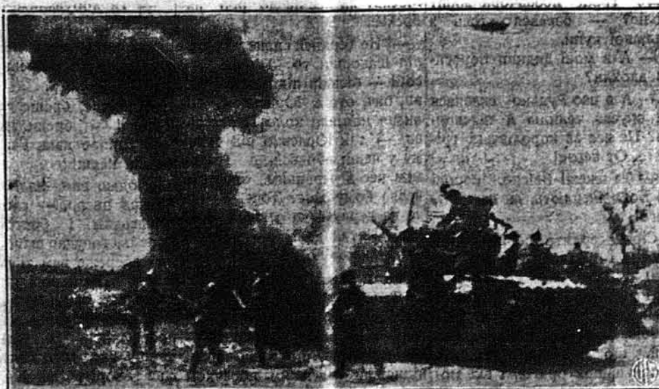
РОСИЙСЬКІ ПОВЗОВІ ВІЙСЬКА. — Як каже російський цензор, ця світлина представляє сцену атаки російських військ, підвезених повозом, на німецьку позицію на західнім фронті. Вояки власне вискакують з повоза й ідуть проти ворога, що знаходиться десь коло горіючого дому. Як другий рік починається, Росія ще далі держиться в війні з нацистами.

ЛОНДОН. — Британські літаки в більшій скількості виконали ще один налет на німецьке місто Емден і його бомбардували. В тім місті міститься німецька субмаринова база. Це звідтам випливають німецькі субмарини на Атлантийський океан в цілі знищення кораблів Об'єднаних Держав. Британці завдали місцеві великі втрати. Самі понесли втрату шістьох бомбовиків.