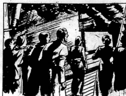
BUT THE CAPTAIN WAS NOT TO BE FOUND ON DECK--AND THE BRIDGE WAS AFIRE.