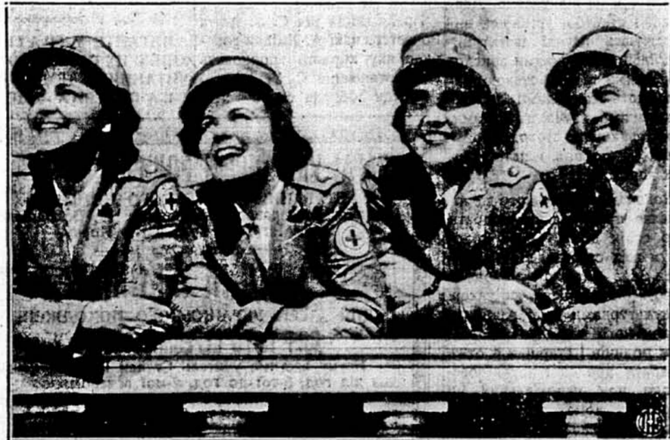
АМЕРИКАНСЬКІ КРАСУНІ В ЛОНДОНІ. — Гарні дівчата, що перед нами, це американки, що працюють в Червоному Хресті. Заки їх поприділявано до різних робіт, дано їм змогу оглянути Лондон, що вони і роблять.

BRANCH OFFICE & CHAPEL: 707 PROSPECT AVENUE, (cor. E. 155 St.), BRONX, N. Y. Tel.: MEtrose 5-5777