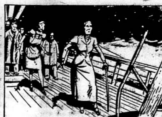
UNDAUNTED, GRANDMA AKERS HASTENED TOWARD THE BURNING SUPERSTRUCTURE. "YOU'LL BE KILLED!" YVETTE SCREAMED.