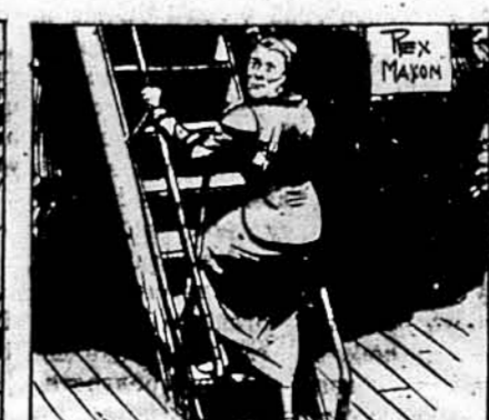
"I DON'T EXPECT TO LIVE FOREVER," GRANNY CALLED BACK JAUNTILY.

Шукаючи за Тарзаном, Івета натрапила на стареньку жінку Ейкерс. Пані Ейкерс сама вже над чимсь промишляла, бо відразу заклікала: „Мусимо видатати ключі від в'язниці“