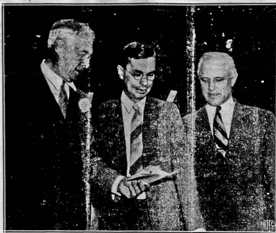
ТРИ ЗНАВЦІ, ПРО КОТРИХ ГОВОРІТЬ ЦІЛА АМЕРИКА. — Про нікого в останніх днях не писали газети так багато, як про Бернарда М. Барука і його комісію, що розслідувала умову проблему, себто ту, що є сьогодні чи не найбільшою журую Об'єднаних Держав. Кажуть, що знаменитий звіт комісії допоможе цю проблему розв'язати. На образку бачимо Б. М. Барука як першого зліва. Другим зліва є д-р Джеймс Б. Конент, а останнім д-р Карл Компто.