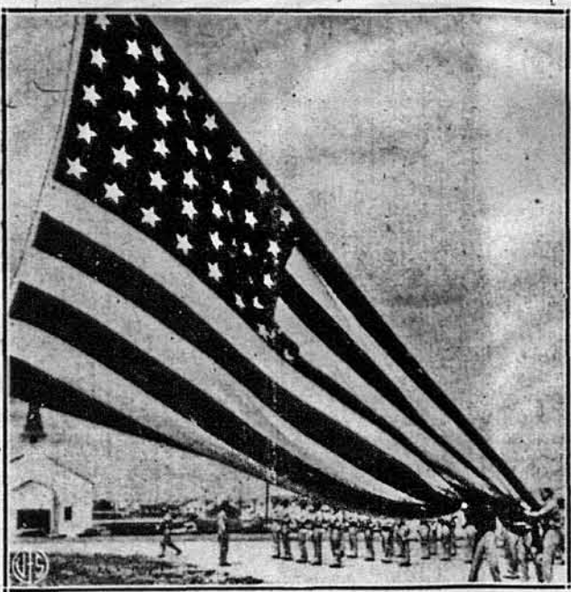
РОЗВИНУТО ШИРОКО АМЕРИКАНСЬКИЙ ПРАПОР. — Це в Кемп Гуд, в Тексас. Прапор розвинуто з цієї нагоди, що Кемп перебрав команда американської армії. Тут буде осередок для нищівників тенків.

На основі цих розпитів Гелоп заповідає, що наступним Губернатором стейту Нью Йорк буде Томас Е. Дюї.