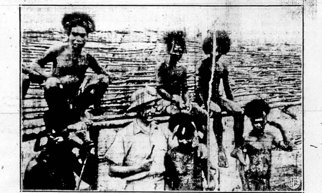
ЙОГО ПРИЯТЕЛІ. Майор Джан Кінні з Сиракуз, Нью Йорк, начальник капелян військ Об'єднаних Держав на південно-західному Пасифіку, зєднав собі прихильність тубільців у Новій Гвінеї. Він стоїть перед розпочатою вже будовою його каплиці.

Не минає багато часу, коли будуть зібрані подібні відомості про молодих хлопців у віці 18, 19 і 20 літ. В конгресі вже внесені законопроекти, щоб їх також покласти до війська, хоч дуже можливо, що конгрес візьме їх під увагу щойно нових рекрутів. Цей один факт ставить перед очима населення щораз яскравіше серйозність війни. Паювання деяких продуктів, стабілізація цін, відсутність деяких предметів розваги, й розкоші і тим подібні обмеження примушують людей до зміни в їх щоденних звичках. Та перехід мільйонів чоловіків з цивільного життя у збройні сили держави цілком певно засягне в саму глибину американського життя.