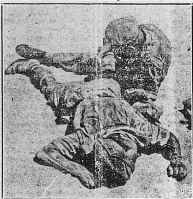
ПОМІЧ НА ПУСТИНІ. Ранений член залоги британського повстання лежить на піску, а його товариш об'являє йому ранену ногу. Повстанці патрулюють фронт на Західній Пустині. По першій перевязці раненого відставлено до „основного шпиталю“ на тилах.

„Але погляньмо назад не далі, ніж на сто літ. Там над рікою Тибром Гарібальді, проти котрого стояли багато численні полки французів, зо сорокою, опосеченою кровю його власних легіонарів, звернувся з голосними словами до своїх дорадників, котрі хотіли би замирення з ворогом: „Хто ще має віру в Італію, най іде за мною!“ і по-