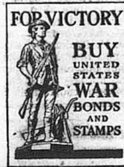
FOR VICTORY BUY UNITED STATES WAR BONDS AND STAMPS

В робучій силі Злучених Держав маємо тепер коло 18,000,000 жінок. В тому не є зараховані ті жінки, що є у військовій службі.