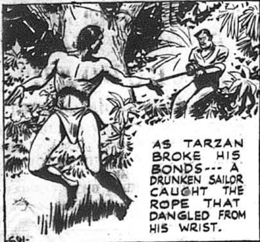
AS TARZAN BROKE HIS BONDS... A DRUNKEN SAILOR CAUGHT THE ROPE THAT DANGLED FROM HIS WRIST.

П'яний моряк сильно схопив за кінець шнурка, що звисав з руки Тарзана. Тим він дешо спинив Тарзана і дав змогу ін-шим повстати.