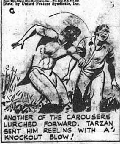
ANOTHER OF THE CAROUSELS LURCHED FORWARD. TARZAN SENT HIM REELING WITH A KNOCKOUT BLOW!

Тарзан сильним сінненням мотузку змусив моряка стрі-голом полетіти в пені дерева. Але в тій саме хвилині вже ін-ший моряк був біля нього.