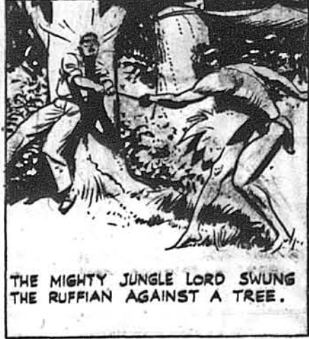
THE MIGHTY JUNGLE LORD SWUNG THE RUFFIAN AGAINST A TREE.

П'яний моряк сильно схопив за кінець шнурка, що звисав з руки Тарзана. Тим він дешо спинив Тарзана і дав змогу ін-шим повстати.