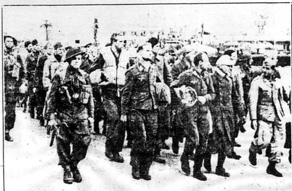
В ДОРОЗІ ДО ТАБОРІВ ДЛЯ ПОЛОНЕНИХ. Маємо перед собою довгий ряд пацієтських полонених, що попали в полон у бою в Північній Африці. Марширують до пристані, звідки їх відвезуть кораблями до тих країн, де Аліанти перетримують полонених. З боку бачимо поважні обличчя аліантських сторожів. Число полонених збільшується шораз більше і це стає для Аліантів поважною проблемою, бо полонених треба перевозити до різних аліантських країн.

ЖЕНЕВА. — На домаганні маршала Карла фон Рундштега усунуто цілу низку італійців з відповідальних становищ командантів італійських гарнізонів на Середземному морі.