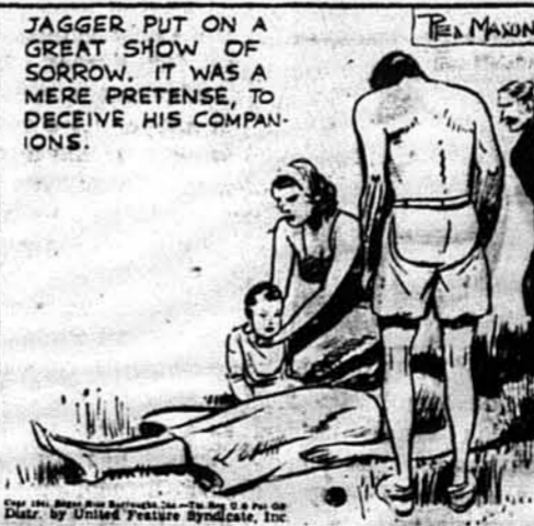
Джегер тепер вдав, що йому дуже жаль. Він рахував на те, щоби цим здурити товарищів.