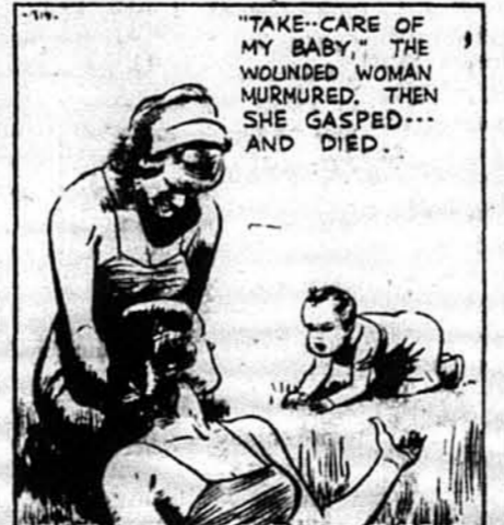
"Подбай за мою дитину", прошептала ранена жінка. Потім здихнула й вмерла. Джегер тепер вдав, що йому дуже жаль. Він рахував на те, щоби цим здурити товарищів.