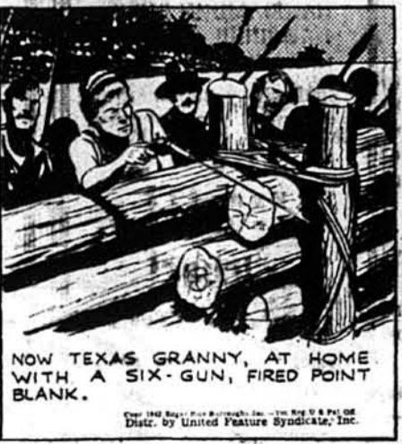
Тепер Тексаська бабка, добре обнакомлена з револьвером, вистрілила наосліп.