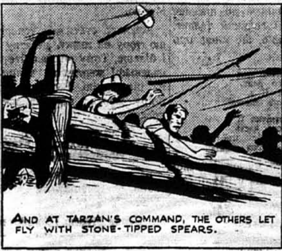
На команду Тарзана інші кинули своїми камінними списами.