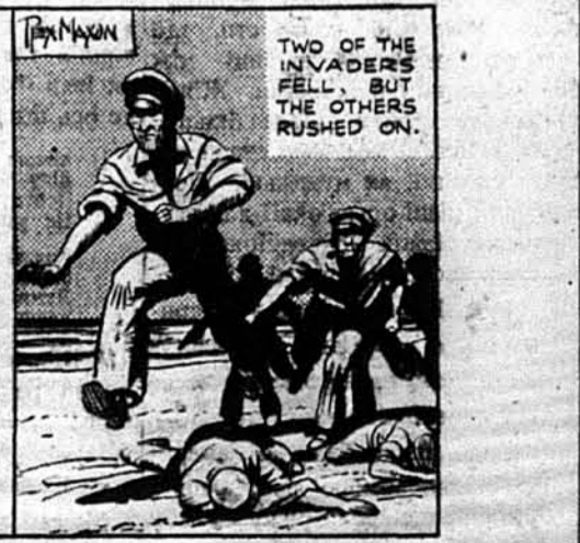
Два рейдери ввали, а інші посунули вперед.