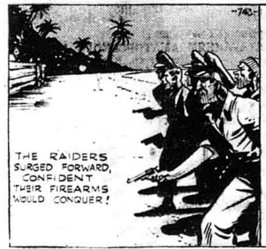
Рейдери кинулися гурмою вперед, певні перемоги своєї палючої зброї.