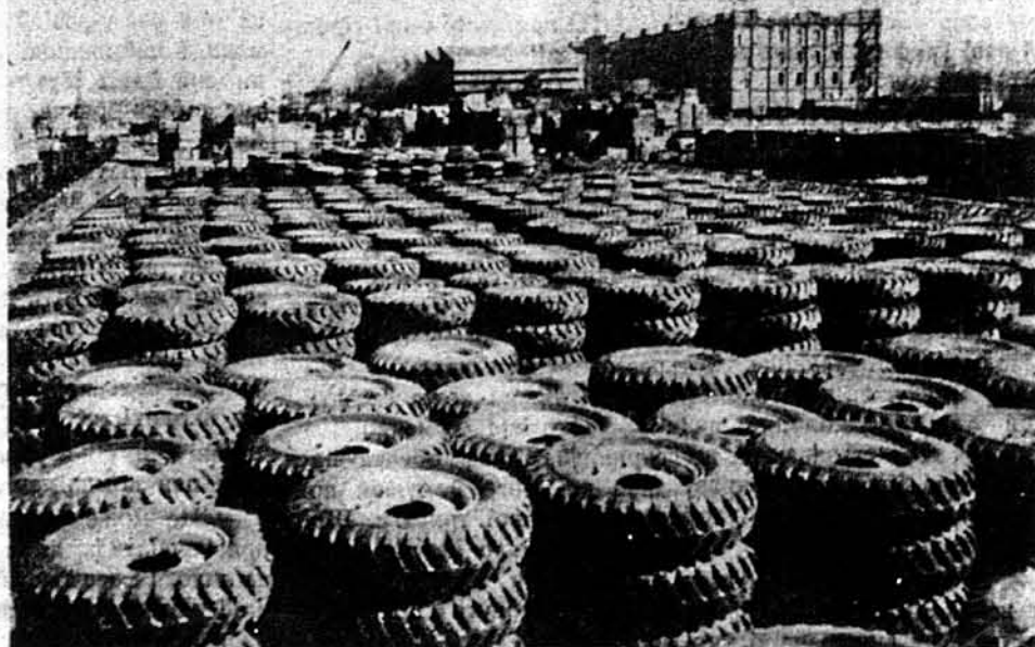
ГУМОВИХ ОПОН Є ДОСИТЬ, АЛЕ ДЛЯ ВОЄННИХ МАШИН.—В одному порті в Індії вивантажено з корабля великі припаси гумових опон, вироблених у Злучених Державах, для воєнної машинерії.

Лондонське радіо подало вістку з Туреччини, що румунський прем'єр Антонеску виїздить до Риму на конференцію з італійським диктатором. Радіо замічає, що ця конференція є віддай одним з перших результатів конференції Мусоліні з Гітлером. Мовляв, Мусоліні хоче заграти роль оборонця Європи й в цей спосіб зібрати коло себе народи Балкану для спротиву аліянтській інвазії.