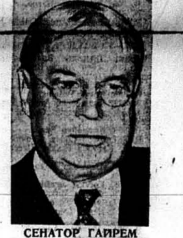
СЕНАТОР ГАІРЕМ ДЖАНСОН, республіканець з Каліфорнії, один з «непримиримих» противників участі Америки в виконанню поліційної служби по світі.