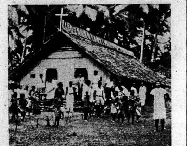
ЦЕРКВА В ДЖУНГЛЯХ.—Тубильці одного острова на Південному морю перед католицькою церквою, збудованою з бамбуса. Остров недавно тому відвідали американські воїки й стрінулися з гарним прийняттям тубильців.

ЛІЦЕНСОВАНИЙ ХРИСТІАНСЬКИЙ ПОГРЕБНИК NEWARK, N. J. NEW YORK, N. Y. Tel. Bigelow 3-3114 Tel. ORchard 4-3378