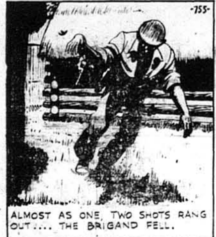
ТАРЗАН, ч. 755. Людські шакалі.

Майже рівночасно роздалися два вистріли... і бандит упав.