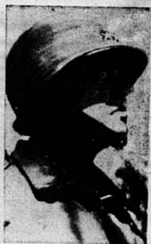
ГЕНЕРАЛ ДЖОРДЖ С. ПЕ-ТОН, що командує американськими військами, які наступають з альянтами на війська маршала Ромеля в північній Африці.

В неділю, 4 квітня, відбулися окружні збори відділів Союзу Українок Америки філядельфійської округи, в яких взяли участь 50 членок восьми відділів С. У. А. Крім місцевих відділів С. У. А., відділи 33 з Кліфтон Гайтс, Па., і 40 з Алентаві, Па., теж вислали своїх представниць.