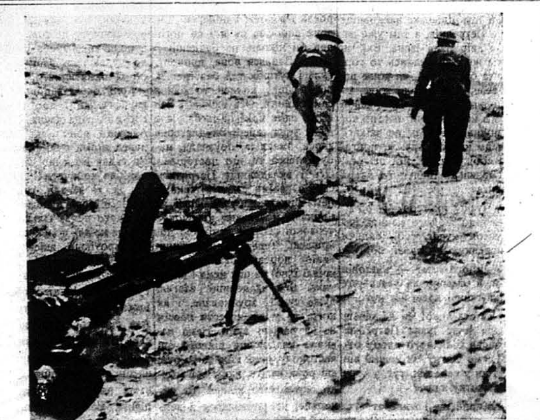
АБИ ЗАВДАТИ СМЕРТЕЛЬНИЙ УДАР.—Ця світлина, прислана з Тунісу, показує, як два британські сапери вибираються на знищення ворожого повзу.

Васілевська закидує урядові Сікорського, що він властиво ніколи не дістав мандату від польського народу, а тільки „вигривається“ в безсумнівній славі геройських польських воєнків, моряків і летунів. Каже, що уряд прем'єра Сікорського втратив симпатії польського народу, доряджуючи їм держатися в партизанській пасивній вибіркової ролі. До цього, мовляв, уряд Сікорського ніколи не порвав з минулим.