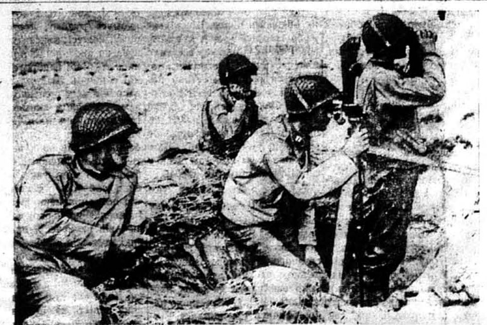
НА ПЕРЕДОВІЙ ПОЗИЦІИ.—Американські воюки на висуненім вперед обсерваційнім пості в долині Ел Гетар у Тунісі, обсервують посунення ворога. Вони доносять свої обсервації головній квартирі свого батальйону телефоном, і на основі їх обсервацій 155-міліметрові гармати починають стрілянину.

ЛОНДОН. — Підчас свого повороту з конференції з Гітлером Ляваль, французький Квіслінг, був ранений вибухом бомби. Репорти замаху потверджені з кількох боків: Його ад'ютант був ранений важко, самий Ляваль легко.