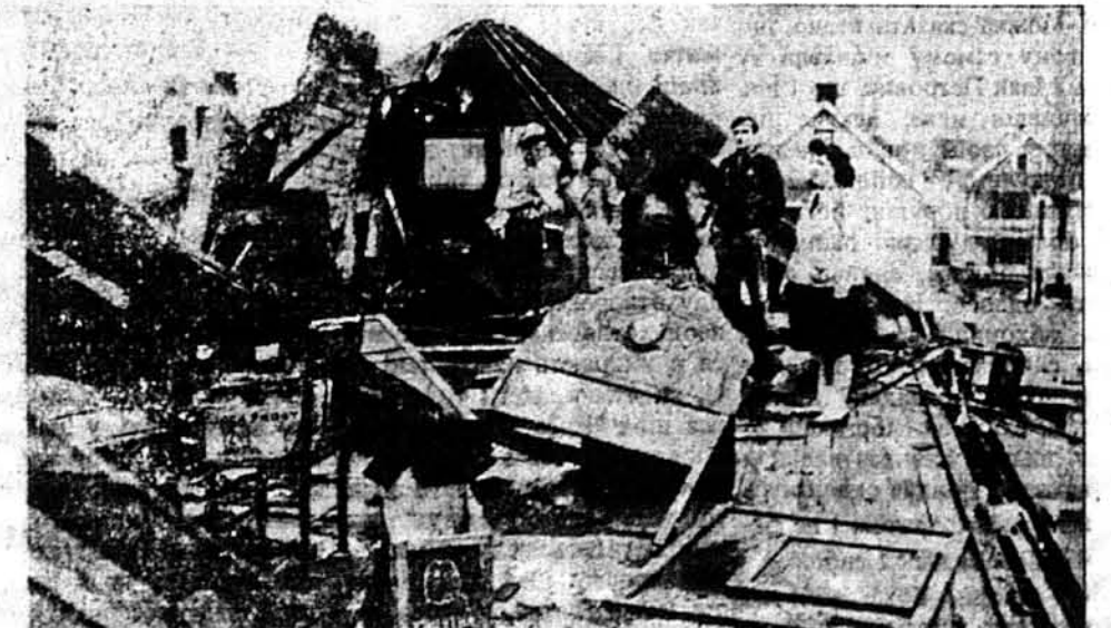
ЖЕРТВИ ТОРНАДА. Три особи згинули, а 150 осіб було ранених у торнаді, що навістило північно-східну частину стејту Огайо. Коло 500 осіб осталося без даху над головою. На світліні дім у Клівленді, з котрого вітер зняв дах.

Газети стараються вгадати, чому саме німецька цензура пропустила цю вістку. Догадуються, що націсти шукають в цій пропаганді виправдання для невдачі своєї кампанії в Росії.