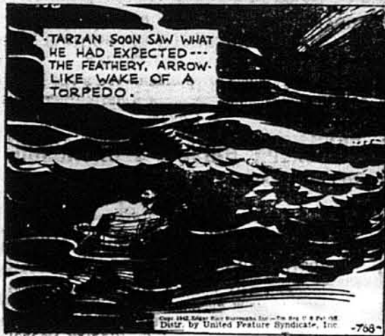
ТАРЗАН, ч. 768. Торпеда.

Тарзан скоро побачив те, чого він сподівався... хвилию, що бігла за торпедою.