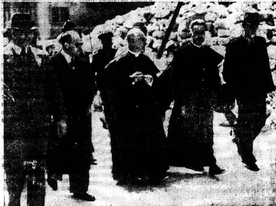
АРХИЕПИСКОП СПЕЛМЕН НА ОСТРОВІ МАЛЬТІ. Ньюйорський архієпископ відвідав Мальту підчас своєї подорожі по Європі й Азії, підчас котрої він був у Португалії, Іспанії, Італії, Англії, Ірландії, Мароку, Альжирі, Тунісі, Сирії й Палестині. Він задумує бути те в Ірані, Іраку, Китаю й Індії. Кружляють навіть чутки, що він хотів би поїхати до Росії.

ЛОНДОН. — Ось таку відповідь дав в британським парламенті Антоні Іден, британський міністер заграничних справ, тим усім, що домагаються тепер розв'язки біженецької ситуації, створеною війною і переселуваннями нацистів.