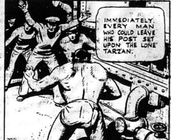
Негайно кожний моряк, що міг покинути свій пост, кинувся на самотного Тарзана.