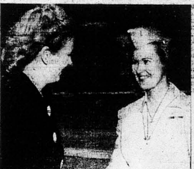
ДВІ ЧЕМПІОНКИ. — Джекеїл Кокрен (наліво), „королева“ американських пильоток, гратулює Айрісе Комінгз, бувшій олімпійській чемпіонці плавання, відзнаки срібних крилець, що її Камінгз дістала по укінченню військового курсу літання.