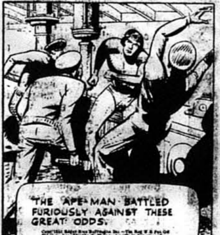
Тарзан бився люто проти переважаючих сил.