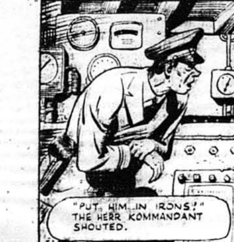
„Закуйте його в заліза!“ почувся крик капітана.