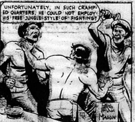
На своє нещастя, в такому тісному місці він не міг ужити своїх вільних засобів воювання, яких він навчився в джунглях.