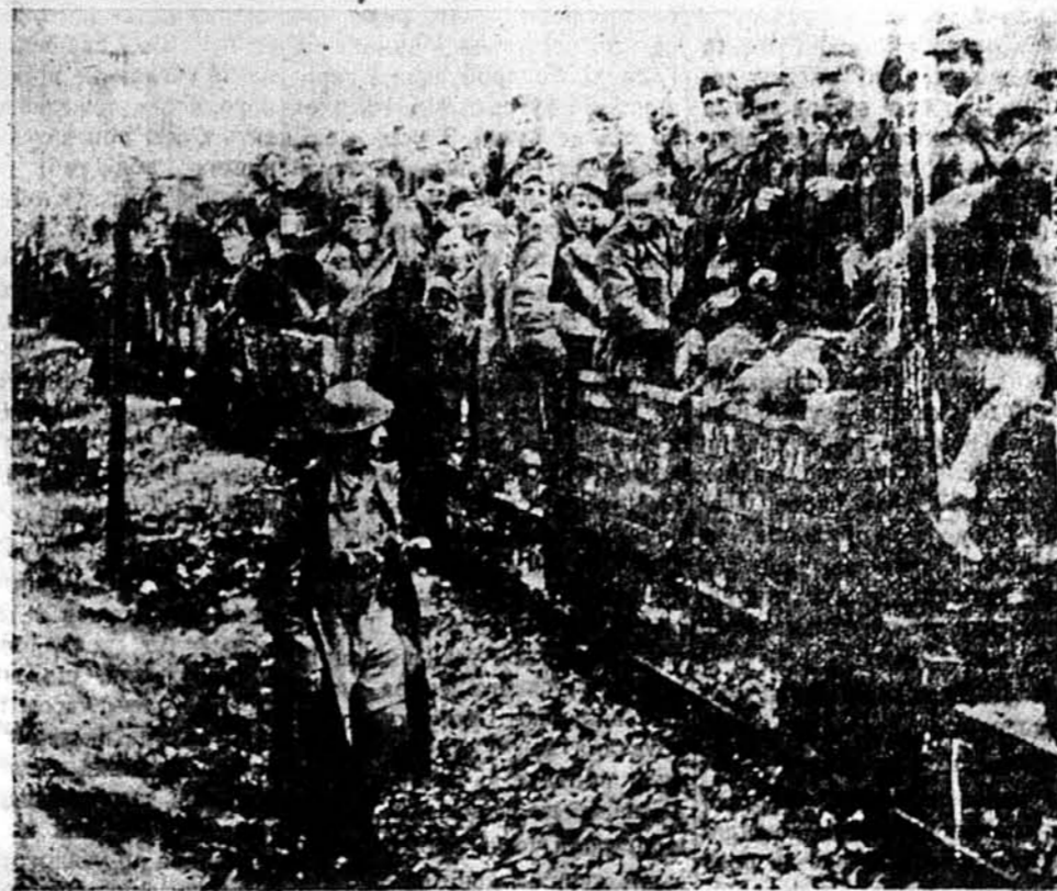
БРАНЦІ.—Як діти, що ідуть на свята, так ці італійські бранці сміються й викрикують, коли їх відправлено з табору-бранців у Громбалі в Тунісі до більше постійного табору.

ЛОНДОН.—Югославський уряд, що перебуває на вигнанні в Лондоні, повідомив Світовий Жидівський Конгрес, що уневажнено всі ті закони та розпорядки, що вважаються антисемітськими, а які видали в Югославії ще до цієї війни. Кажеться, що „воли противорічать ліберальним традиціям цього краю“.