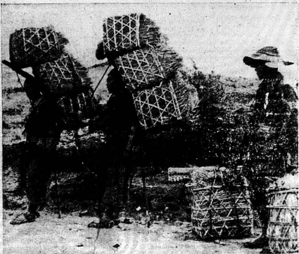
ВЮЧАКИ. — Китайські „кулі“, що несуть величезні тягарі бурмським шляхом, задержуються на дорозі для відпочинку. Їх кауки мають у собі медичні причадади, харчі й амуницію для воюків на фронті Салвіну. Спочинаючи, вони спирають звичайно свої кауки на підвішні прив'язані до кауків.