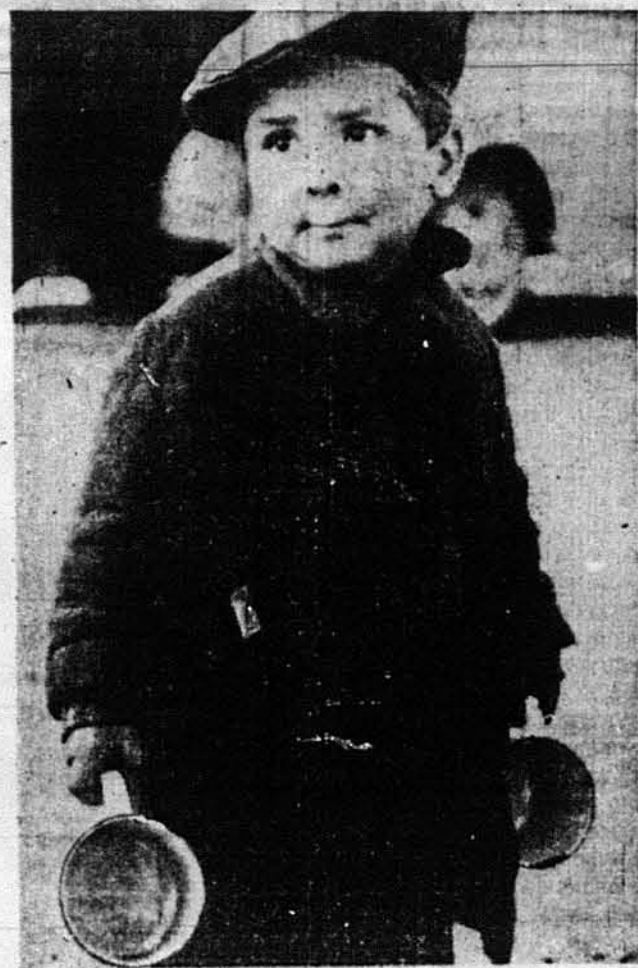
ГРЕЦЬКА ТРАГЕДІЯ. У таборі Мозеса Вела коло Суєзького каналу, що призначений для збігців з близького Сходу, знаходиться отьей малій грецькій втікач, на котрого обличчю висіпані труднощі й терпіння грецького населення під німецькою окупацією.

Здоровий і працездатний такий подорожчак раби звиробитник, у силі віку, коштів до 1000 мільреївс!) До такої ціни доходили невольничі-жінки. Діти й старі раби розцінювалися дешевше: по 50, 100, 200 мільреївс. Невільництво, що відзначалося особливо високою ціною, як породисті коні чи що.