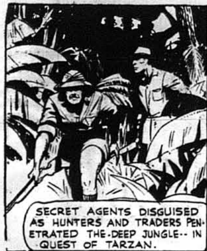
ТАРЗАН, ч. 792. Полювання на чоловіка.

Тайні агенти, перебрані за мисливих і торговців, зайшли за Тарзаном навіть у глибокі джунглі.