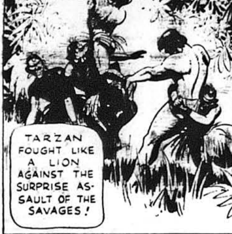
ТАРЗАН, ч. 794. Пійманий.

Тарзан боровся як лев перед несподіваним нападом дику-нів.