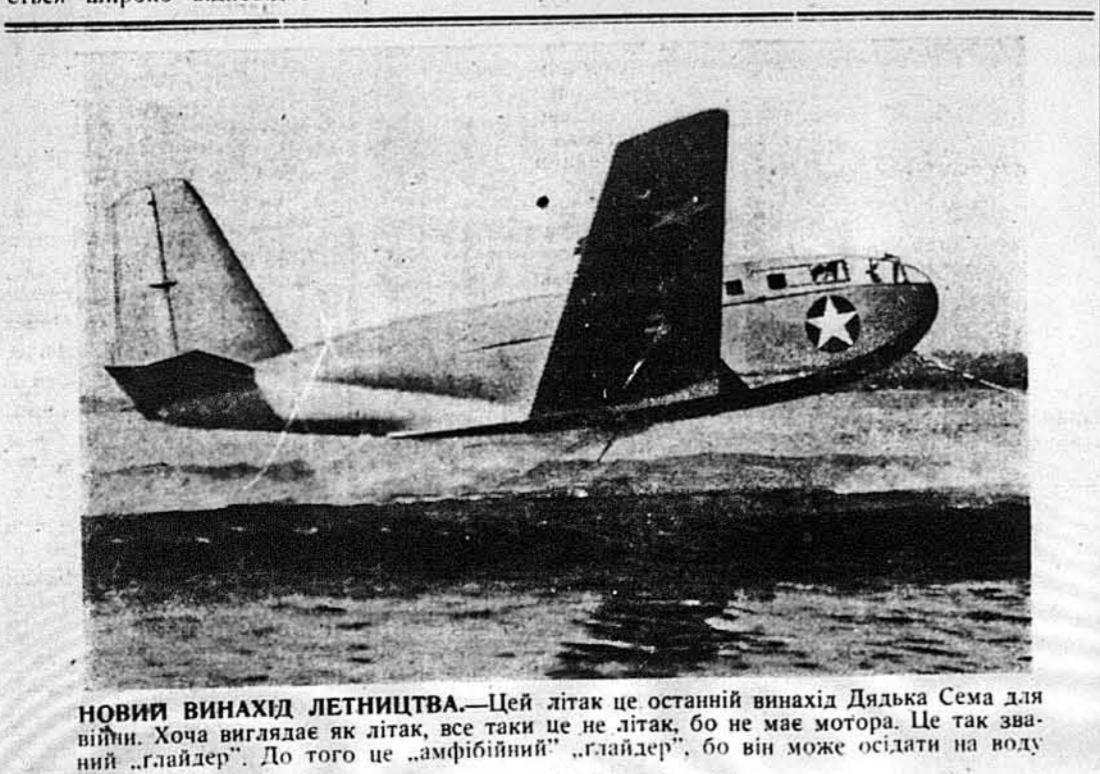
НОВИЙ ВІНАХІД ЛЕТНИЦТВА. —Цей літак це останній винахід Дядька Сема для війни. Хоча виглядає як літак, все таки це не літак, бо не має мотора. Це так званий „глайдер“. До того це „амфібійний“ „глайдер“, бо він може осідати на воду і на сушу.

JULY 4th 1943 В ПАРКУ УКРАЇНСЬКОЇ ПРАВОСЛАВНОЇ ЦЕРКВИ 675-681 SO. 19th ST., NEWARK, N. J. В НЕДІЛЮ, 4. ЛИПНЯ (JULY 4, 1943) В 3. год. пополудні розпочнеться П-К-Н-К В 6. год. Спільна Вечера і промови на тему дня, опісля забава при добірній Орхестрі. Прімімо Вас прійти на це свято. Вступ вільний. КОМІТЕТ.