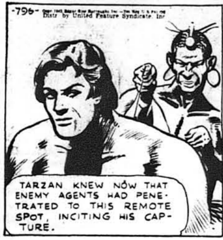
Тепер Тарзан уже знав, що агенти ворога зайшли аж у цю околицю.