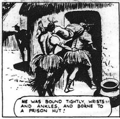
Його звязали туго й занесли до хати.