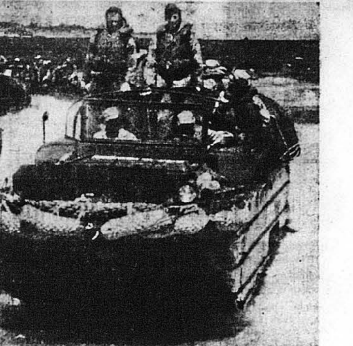
ІДЕ СУШЕЮ Й ПЛИВЕ ВОДОЮ. Воєнки з „спеціальних інженерських бригад“ американської армії вживають тепер цікавих трюків, що їдуть землею, а приїхавши до води переминаються на човни, за простим пересушенням „гірив“. Американські воєнки негідно охрестили ці троки качками, видно натякуючи на те, що й качки ходять по землі й пливають по воді.