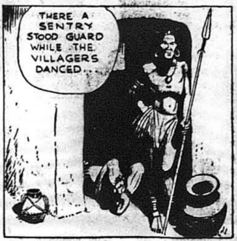
Над ним поставлено сторожу, підчас коли люди стали танцювати...