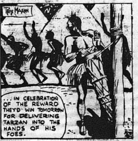
... з радости, що вони дістануть нагороду за доручення Тарзана.