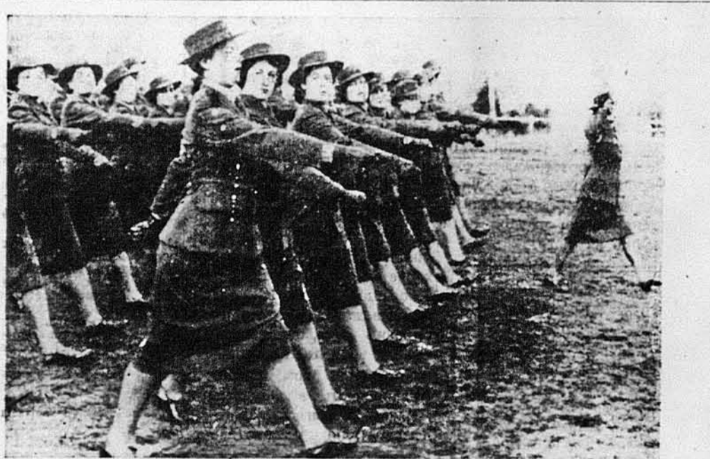
ЧИ ГІРШЕ МУЖЕСЬКОЇ АРМІЇ? Жінки, що належать до Австралійської Жіночої Помічної Служби, що відвідає американським „Вакс“, на перегляді перед своїм командантом, генералом Каномом.