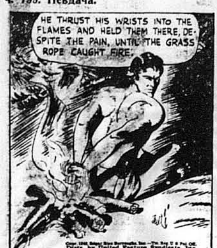
Він засунув руки в огонь і подержав їх там хвилину, поки шнур не прогорів.