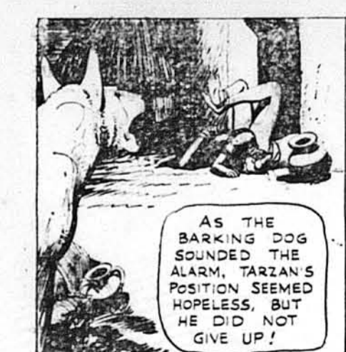
Як гавкання собаки підніло аларм, позиція Тарзана стала безнадійна. Але він усеце не здавався.