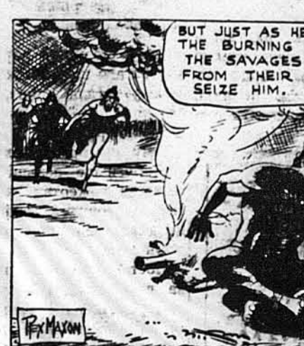
Але власне як вязи пустили, дикуни стали бігти до нього з хат, аби його схопити.