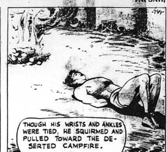
Хоча його руки й ноги були зв'язані, він підсунувся до покинутого огню.