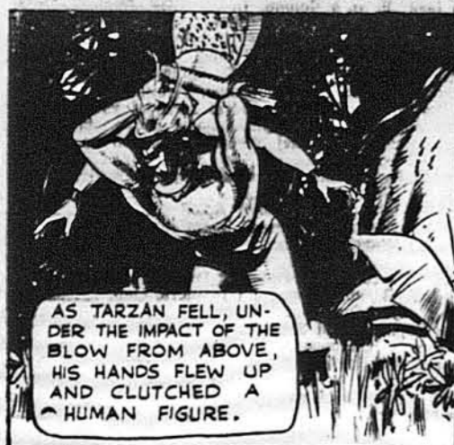
ТАРЗАН, ч. 805. Зіля вертається.

Падаючи на землю від удару, Тарзан скоро посягнув руками догори й піймав якусь людину.