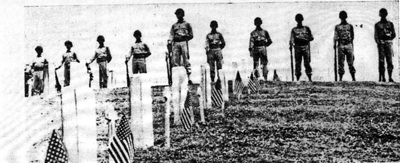
ВОНИ ВІДАЛИ СВОЄ ЖИТТЯ ЗА СВОБОДУ — і тепер їх тіла спочивають у гробах, зазначених хрестами й прапорами. Товариші, що стоять над їх гробами, ждуть, аби віддати в їх честь три вистріли.

Головні труднощі у розвитку шовкового промислу були досі, це платня робітників і таки много заходу біля шовковичок. Та це була давня сістема, яку колись уживали у цьому промислі, а тому, що ніхто серйозно не посвятився цій культурі, тому ніхто не знав, як краще і простіше розвинути цю працю. Тепер однак, як каже Гіль, кожна фармерка на своїй фармі може дуже легко розвинути працю бі-