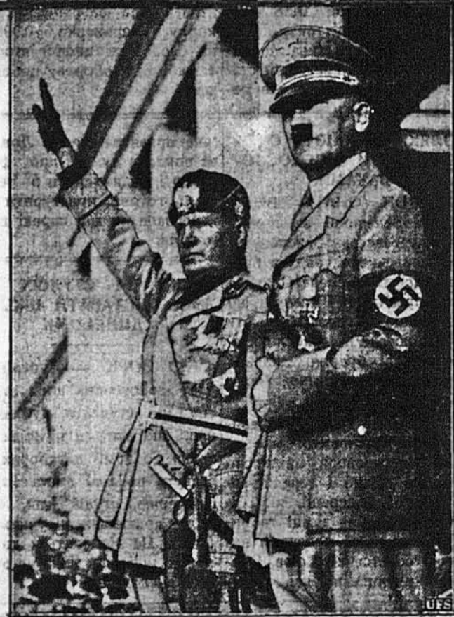
З МИНУЛОГО МОГУТНЬОГО КОЛИСЬ ДУЧЕ. Мусоліні й Гітлер підчас одної з своїх стріч.