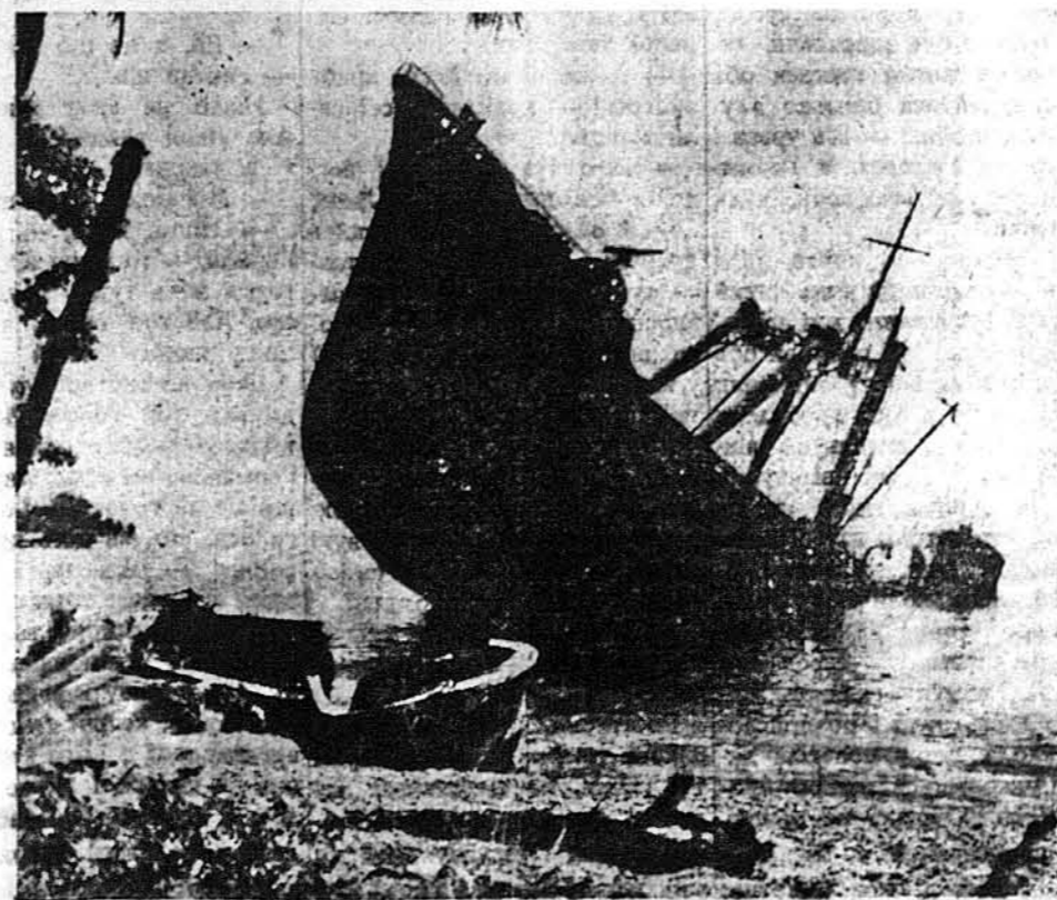
ОДНОГО ВОРОГА МЕНШЕ. — Японський корабель при березї Гвадалканалу авернувся передом до неба, а задом до морських глибин, де потонула більшість його залоги. Його поцілили були бомби американців.

Уступлення Мусолїні викликало радість у Франції, де сподїваються скорого відмікнення Італійських вїйськ зо Савої.