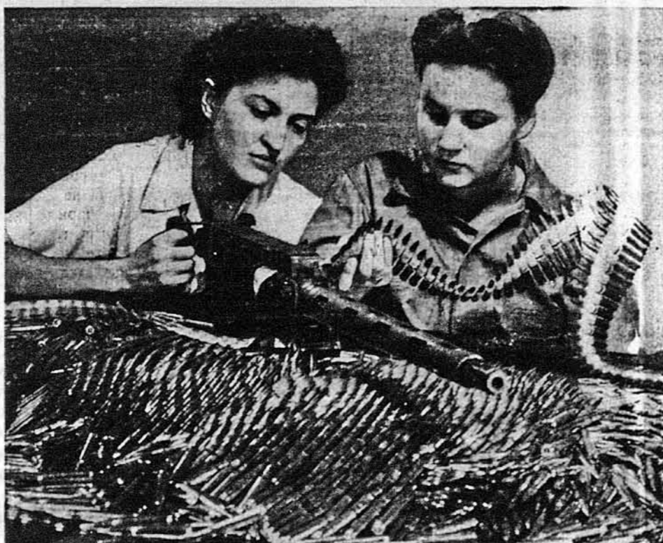
СКОРОСТРІЛЬНА РУШНИЦЯ.—Американські летуни вже вживають у Сицилії й над Європою нової рушниці, холодожею повітрям. Вона може вистріляти 700 куль за 30 секунд. На світліні, коло рушниці лежать патрони куль, вистріляних за пів хвилини. Жінки коло рушниці працюють у фабриці Ремінгтона в Бриджпорі й займаються інспекцією вироблених рушниць.

УВАГА: З причини малої кількості примірників, просимо замовляти тільки ці книжки, що є подані у повнішому оголошенні. Замовлення разом з належитістю слати до: P. O. Box 346 Jersey City, N. J.