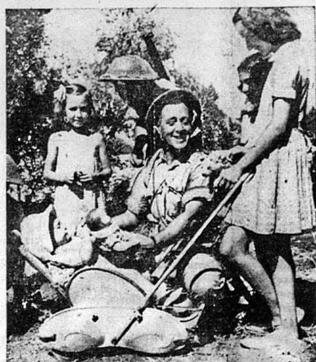
ДАЮТЬ СОБІ РАДУ БЕЗ ЗНАННЯ МОВИ. —Такі сцени як повніша, це тепер дуже часті в Сидилії. Бачимо англійського воюка, як збавляється з італійськими дітьми, хоч не знає італійської мови, а діти англійської.

ЯКЩО БАЖАЄТЕ ДІСТАТИ ТАКЕ ОБЕЗПЕЧЕННЯ, ЯКЕ БУЛОБ ПЕВНЕ ТА МОДЕРНЕ, А ЗА ЯКЕ ТРЕБА ПЛАТИ НИЗЬКУ ОПЛАТУ, ТО ОБЕЗПЕЧИТЬСЯ В УКРАЇНСЬКІМ НАРОДНІМ СОЮЗІ.