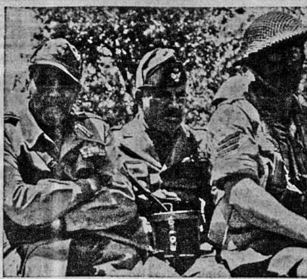
РОЗЧАРОВАНИ ІТАЛІЙСЬКІ ШТАБОВЦІ В ДОРОЗІ ДО БРИТИСЬКОГО ТАБОРУ ДЛЯ ПОЛОНЕНИХ. —З обличчя ось тих високих італійських офіцерів, що попали в британський полон, видно, що вони дуже засумовані й розчаровані тим, що воювали проти Аліянтів.