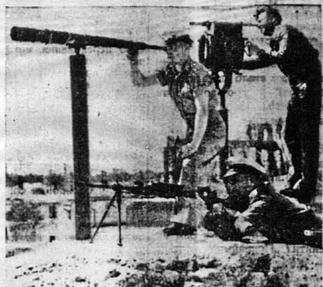
ПОСТІЯНО НА ВАРТІ. Це, що бачимо на образку, теж вказує наглядно, що острів Кипр відіграє ролю в стратегії Аліантів. Бачимо, як з острова слідять за ворожими повітряними і морськими рухами.

Натомісь історія Старого Села, ледви одну мило відда-леного від княжого Звениго-роду, більше цікава. За кня-жих часів існувала тут оселя звана Чертинськом, відтак Чертинкою або й Чертовом. Провсвиралася вона продовж пото-ків, званих нині Чертинкою й Давидівкою, поміж Шоломи-єю й Звенигородом від сходу а Тодидеюм і Волковом з за-ходу. Нині на цьому просторі є дві громади — Чертин і Старе Село, якого північно-західна частина межуюча з Черви-ном, так і зветься Чертинкою. Традиція означає початки нинішнього Старого Села XII-роком, коли паном Звениго-родської волости був князь Давид Ігорович, що до речі кажучи, вернувши з походу на половців, заложив половецькими бранцями недалеко село Давидів. Наслідник Давида Володимирко Володаревич по-ширив оселю Чертова й полу-чив її битими шляхами з Да-видовом і Звенигородом. Об-лога Звенигородом Васильком і рейши його маєтності на Данилом Романовичам в 1211 р. причинилася цілковитим знищенням доволічичих осель, м. Т. Чертова й Шоло-ми, на яких жили собі тодіш-