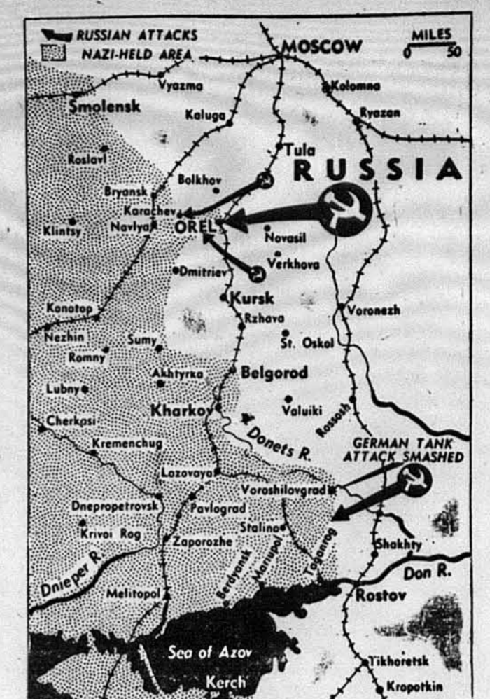
В НАСТУПІ НА УКРАЇНУ. — Ось мапа представляє воєнне положення на советсько-німецькому фронті. По здобуттю Орела і Білгороду советський війська наступають з двох боків на Україну. В першу чергу намагаються вони здобути Харків, де, як надїються, німці ставитимуть найважливіший опір.