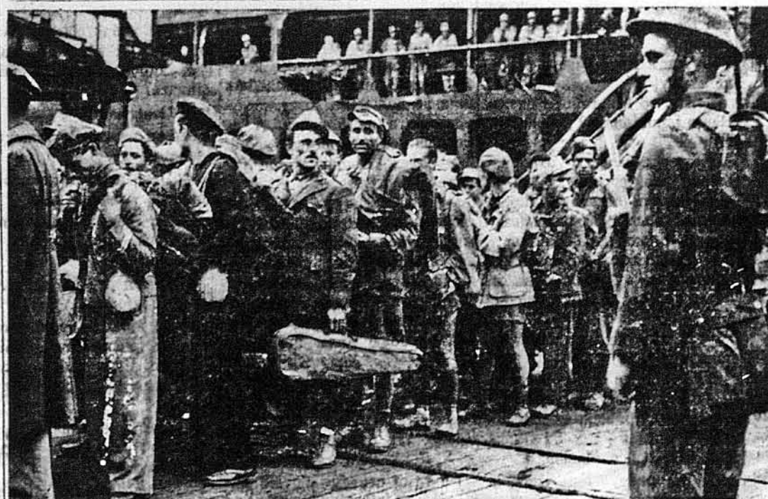
РАДІ, ЩО ОПІНИЛИСЬ В БРИТАНСЬКІМ ПОЛОНІ. З обличчя тих італійських полонених, що їх перевезено з Сицилії до Англії, цілком не видно смутку, що вони „в неволі“. Заміне, що до цієї „неволі“ йдуть з скрипками, гітарами та іншими музичними інструментами.

ЛОНДОН. — Коли іде про урядові британські кола, то можна сказати, що вони ставляться з прихильністю до перемини в югославській уряді на вигнання, на якого чолі став тепер прем'єр Божідар Пурич. Та між югослов'янами не видно того оптимізму, бо нема далі порозуміння між сербами, хорватами і слов'яніями. Новий уряд має перенести свій осідок до Каїро, щоби бути ближче рідної землі.