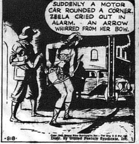
Нагло на скрутї вулиці показався автомобіль. Дівчина крикнула з перестрашу. Стрїла свиснула повітрям.