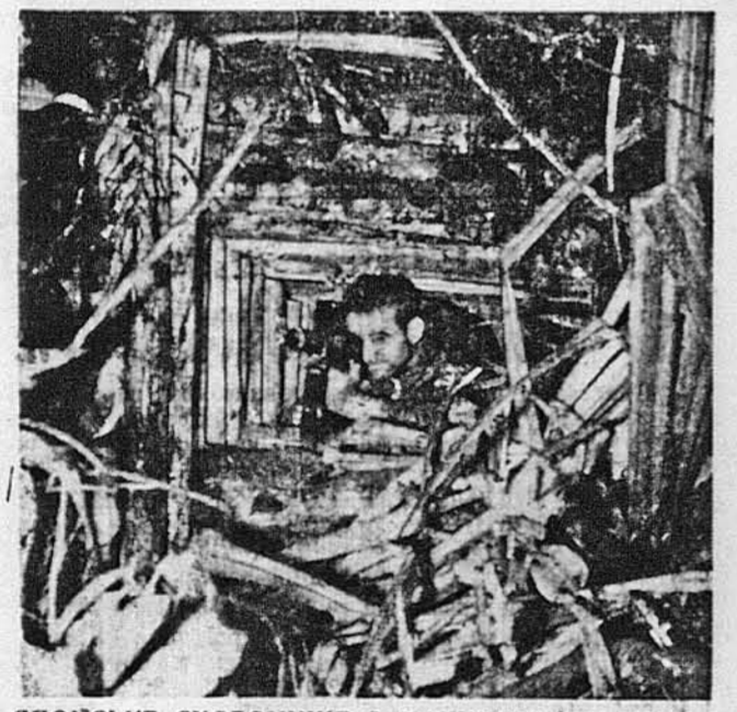
ЯПОНСЬКЕ СХОРОНИЩЕ З МАШИНОВИМИ КРАСАМИ. — Ось так виглядає одна з японських камуфляжованих кривок, що їх повно в Новій Гвінеї. Здобуто її американськими військами підчас останньої Аліантської офензиви на Полудневій Паціфіку.