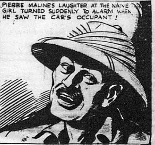
Усміх радости Малїна переминився нагло на страх, коли він побачив, хто сидїв в авті.