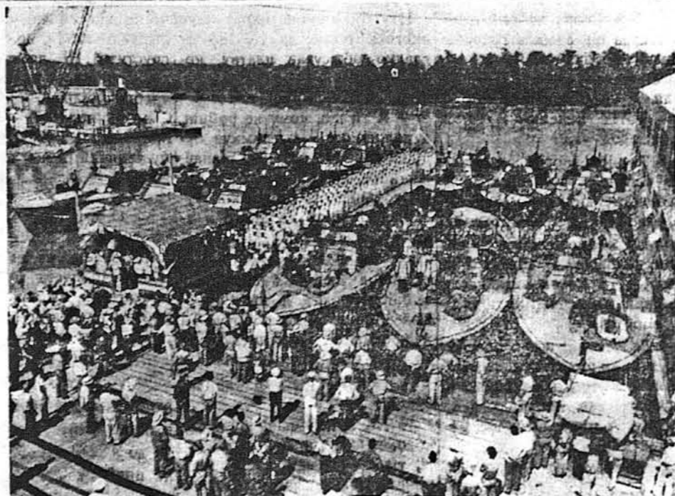
АРХІЄПІСКОСЬКЕ БЛАГОСЛОВЕННЯ. — Це одна з „надзвичайних картин“. Представляє, як католицький архієпископ благословить „HIGGINS PT BOATS“. Архієпископа бачимо стоячого в судні, що є в середині.

БЕРН (Швайцарія). — Уряд Бадоля оголосив, що хоч він проголосив Рим „отвертним містом“, то це матиме значіння доперва тоді, як ворог це визнасть. Поки цього нема, місто може бути законно далі бомбардованим.