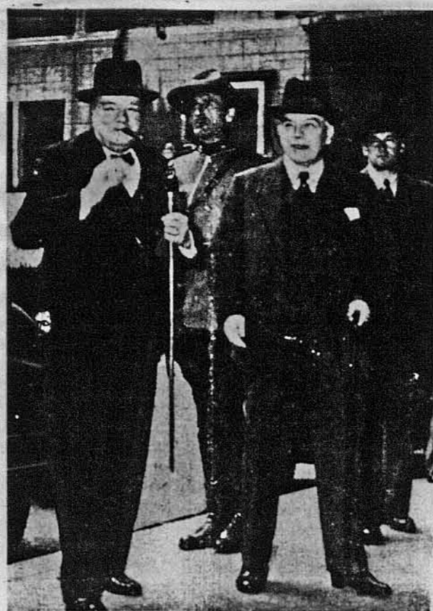
ВДОВОЛЕНІЙ ЧОРЧИЛ. — Теперішній вигляд британського прем'єра, Вінстона Чорчила, цілком не подібний до того, що його мав, коли заповідав тяжкі часи. Бачимо його в добром гуморі в товаристві канадійського прем'єра В. Л. Мекензі Кінга, що прибув до Квебеку на повитання Чорчила.

І тут знов редактор УГ вмовляє в американських читачів, що хтось там є між українцями такий, що Польщу ставить в евентуальнім плебісциті на першій місці, що є хтось такий, що хоче прилучення Західної України до Польщі. У мой статті: до Канадійських Земляків, що на Раді Зіздяться“ я писав так: „Для нас, українських людей, та воля (західних українців) ясна, але кому з чужих воля сумнівна, нехай рішає свобідне голосування з трьома можливостями: самостійність Західної України, анексія до Росії чи до Польщі. За вислід, ми, західні українці, не боїмося“. У.Г. суггерує, неначе були українці, що хотілиб прилучення Західної України до Польщі зі застереженнями, чи