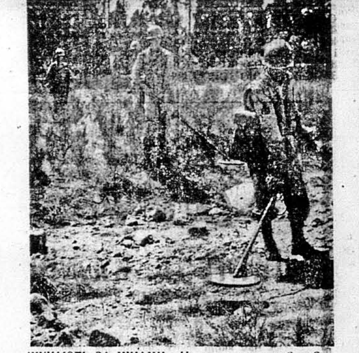
ШУКАЮТЬ ЗА МІНАМИ. Ця сцена знята в Сан Стефано, в горах в Силізії. Американські вояки розглядаються по терені, шукаючи за німецькими мінами. Це дуже небезпечне завдання, бо кожної хвилини можна наступити на міну, що вибухне. Треба отже ступати дуже осторожно. Ось так прочищується дорога для переходу армії.