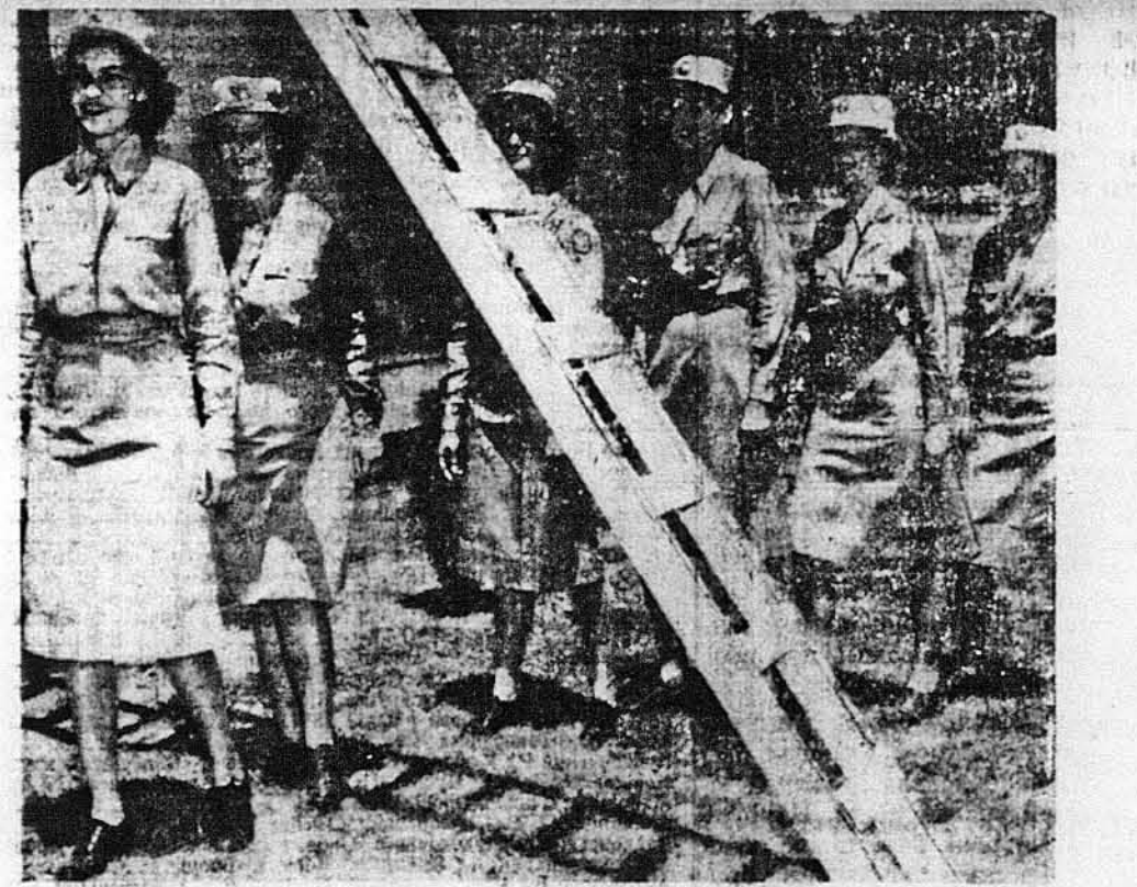
ЗАБОБОННІ?—ТА ДЕЖ ТАМ! —Хто каже, що ВЕКС є забобонні? Отже неправда. А щоби показати, що так є, бачимо, як переходять по під драбину як тільки стали частиною Американської Армії. Знімка з Форт Ворт, Тексас.