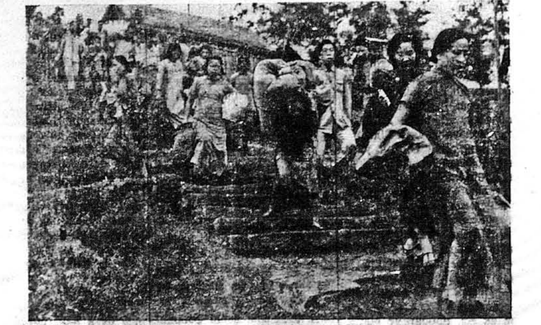
НЕ ЗАЛЯКАНІ ЯПОНСЬКИМ БОМБАРДУВАННЯМ ЧУНГКІНГУ. — По довгій проволоті японці зачали наново налітати на Чунгкінг, столицю демократичного Китаю. Та люди, хоч не були свідками бомбардування вже біля двох років, не залякалися, а спокійно забирають найкращі річки і переносяться з ними до схоронищ перед повітряними рейдами.

ЛОНДОН. — Німецьке радіо сповістило німецькому народові про те, що Гітлер назначив міністром внутрішніх справ Гайнріха Гімлера, голову зненавидженого Гестапо, головного винуватця нацистських злочинів. Замітне, що радіо представило Гімлера як „благородного джентельмена, співчужаючого з простим народом, і тощо відчувачого свого співгромадянина“. З цього, що Гітлер поставив Гімлера на становищі міністра внутрішніх справ, виходить, що він боїться неспокою в Німеччині, в першу чергу через альянтські бомбардування. „Вспокоювати“ буде тепер німецький нарід Гестапо. Так воно виглядає.