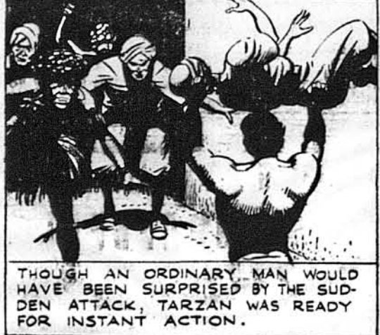
ТАРЗАН, ч. 826. У кішках рук.

Пересічний чоловік був заскочений цим наглим нападом, але Тарзан був готов до скорого діланья.