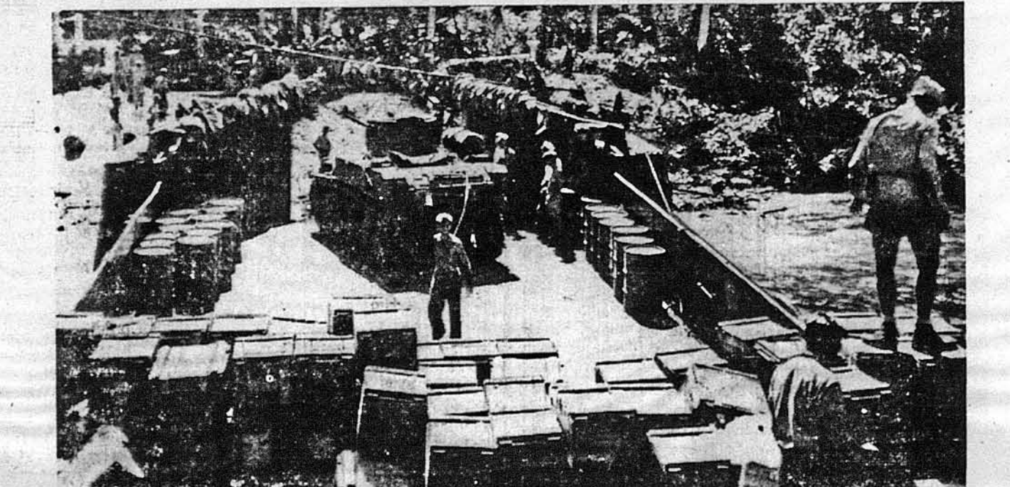
ВОЄННЕ ЗНАРЯДДЯ ДЛЯ МУНДИ. — Американська команда скріплює на всі способи відібрану від японців воєнну базу в Мунді в Нью Джордія Айтленд, що має велике стратегічне значіння. На образку бачимо, як ладують на кораблі тенки, газоліну і амуніцію, що призначені для Мунді.