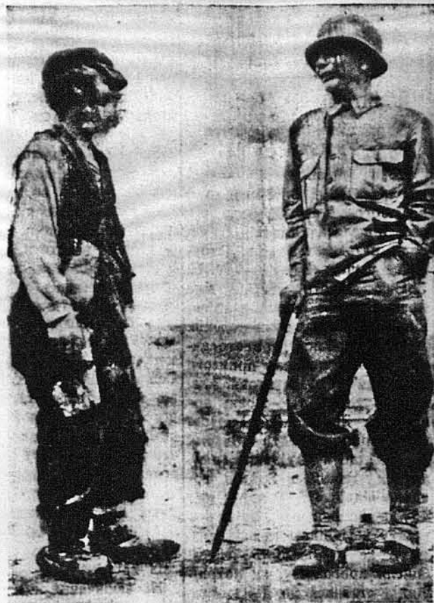
АМЕРИКАНСЬКИЙ ГЕНЕРАЛ І ІТАЛІЙСЬКИЙ СЕЛЯНИН НА РОЗМОВІ. — Це ген. Тіодор Рузвельт, син бувшого президента Злучених Держав. Будучи на фронті в Сицилії розмовляв з італійцем-селянином, що весь у лахміттях. Видно, що фашистська влада не так то дуже дбала за селян, як це виглядало з її пропаганди.

Тому теж в багатьох державах почали шукати за дешевим джерелом цукру, який заступив би дріжджам мелясу. Шукали і знайшли: звичайна деревляна целюлоза і соломи т. зв. багатоцукром зложе-