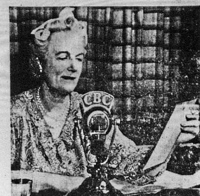
З КАНАДИ ДО СТАРОГО КРАЮ. Це пані Вінстон Чорчилл говорить через радіо з Квебеку в Канаді до своїх в Англії. Було це підчас Квебекської Конференції.

Червоній Хрест потребує кожного добровольця, якого може дістати. Не робить ріжниці чи та особа може присвятити годину праці, чи цілий день для Червоного Хреста. Червоній Хрест закликає групи і окремі особи, щоби зголошувались до праці в міру своїх можливостей.