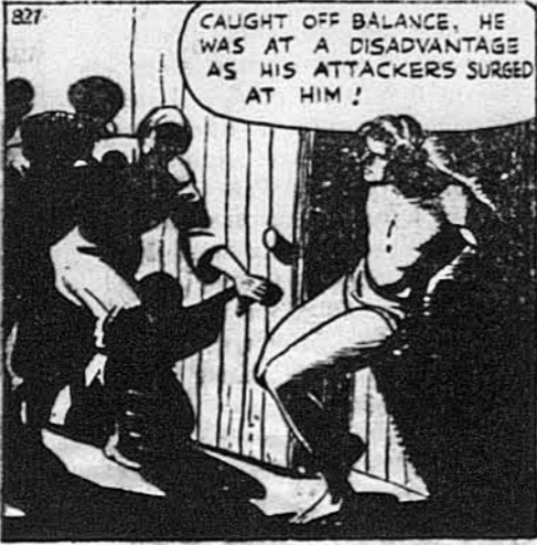
Він стратив рівновагу, а його вороги кинулися на нього.