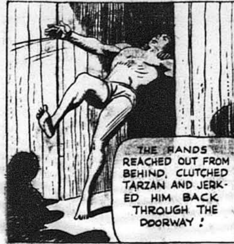
Руки простягнулися із заду, скопили Тарзана й потягнули його в двері.