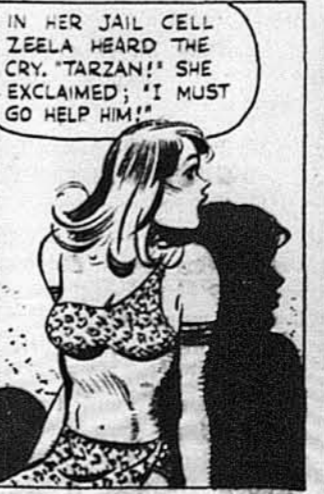
У своїй в'язниці голос цей почула Зїла. „Тарзан!“ вона крикнула. „Я мушу йому допомгти“. Але залізни крати кавади їй: „Не поможеши!“