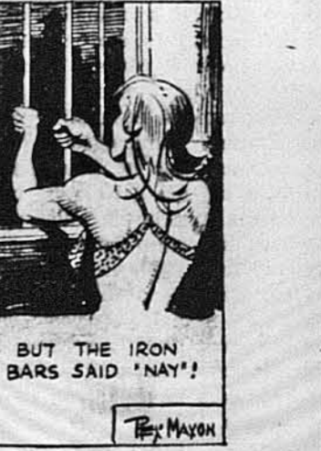
Але залізни крати кавади їй: „Не поможеши!“