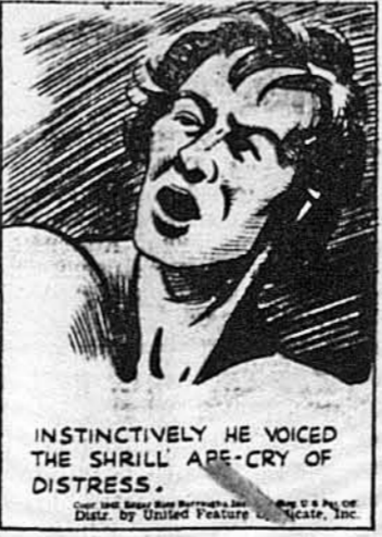
Істинково він видав зо себе маллячий крик роспуки.