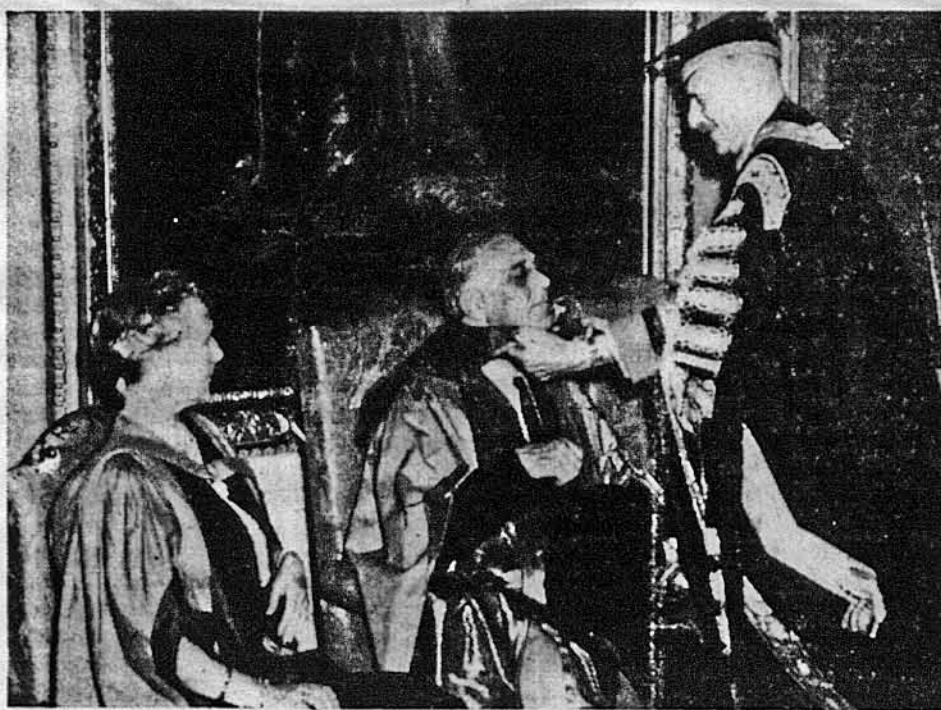
НАДІЛЕНО ПРЕЗИДЕНТА РУЗВЕЛТА ЩЕ ОДИМ ПОЧЕСНИМ ДОКТОРАТОМ.— Ирл Атлону, генеральний губернатор Канади, відбуває як канцлер Юніверзиту оф Лондон церемонію з наділенням титулу почесного доктора права президентом Рузвелтові. Принцеса Еліс, дружина губернатора, є свідком цієї церемонії.

хіба через убиття. Однак нації живуть так довго, як довго в них існує свідомість їхнього права на існування.