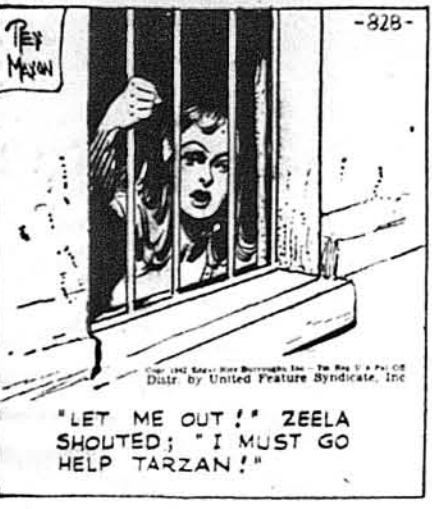
„Випустив мене!“ Зіла кричала. „Я мащу помотти Тарзанови!“