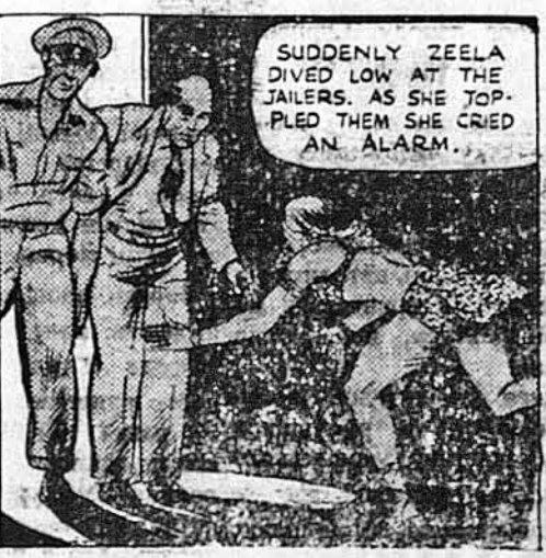
Нагто Зіла кинулася до ніг. Як вони звалилися, вона вида-ла окрик.

„LET ME OUT!“ ZEELA SHOUTED; „I MUST GO HELP TARZAN!“