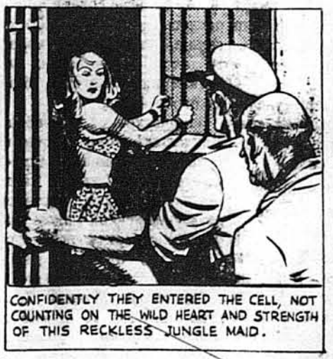
З довірям вони ввійшли до в'язниці, не знаючи ні завзяття ні сили дивної дівчини.