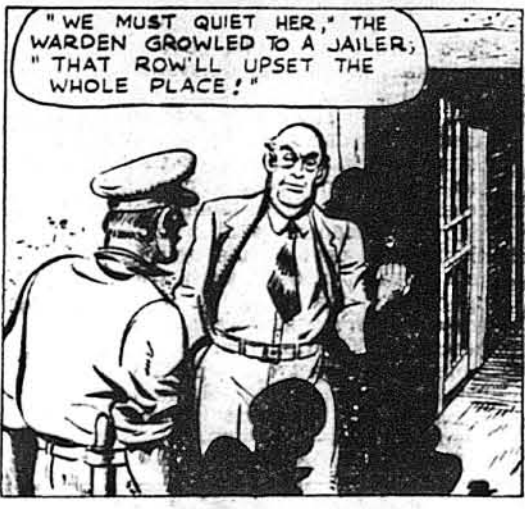
„Ми мусимо її успокоїти,“ сказав начальник в'язниці сному сторожеви; „цей крик може збудити ціле місто“.