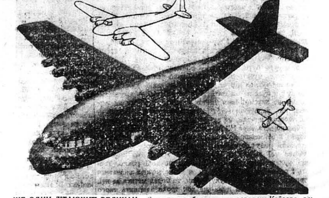
ЩЕ ОДИН ЛІТАЮЧИЙ ВЕЛИКАН. — Саме тепер будують у заводах Кайзера ось такого літака-великана для перевозу вантажу. Він буде майже тричі більший від подібних літаків, що їх тепер уживаємо. Погляньте на Літаючу Фортецю, що є нагорі, та на другого американського бомбера, зправа, а будете мати поняття, що це за великан.

ЛОНДОН. — Від поведілка вилітають як день так ніч формації Американських Літаючих Фортець до Німеччини і Франції для бомбардування важких воєнних об'єктів. Те саме, очевидно, робить і Бритійська Повітряна Сила. Ще далі бомбардується Рур, а в Франції летунські поля та фабрики воєнного знаряддя. Кажуть, що понад Англійським каналом літають весь час цілі повітряні фльоти. Одні з налетом, другі з поворотом.