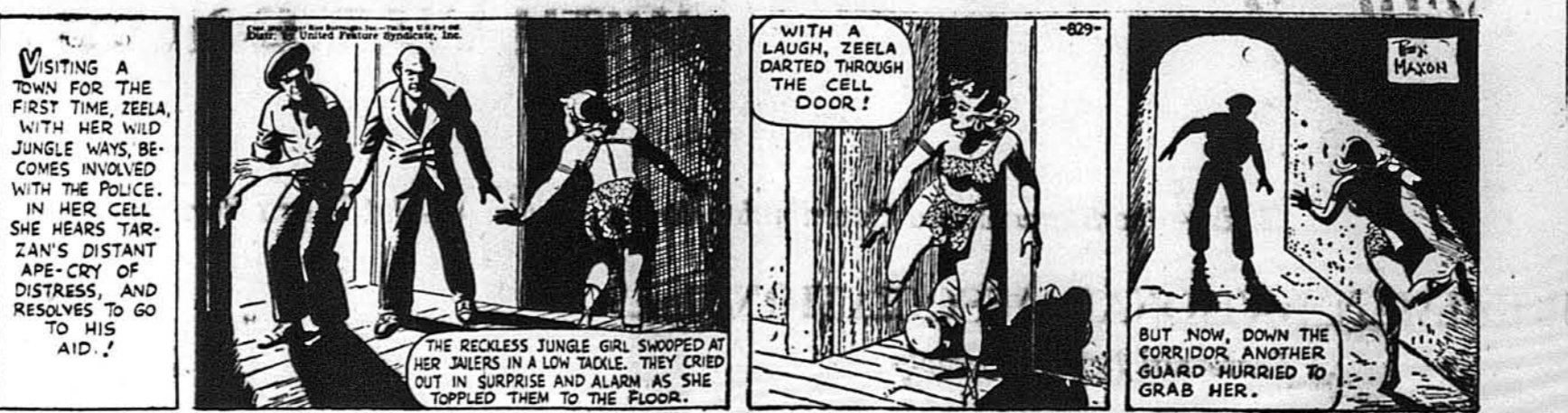
ТАРЗАН, ч. 829. Перешкода.

Але на коритарі вона попала на іншого сторожа, котрий хотів її схопити.