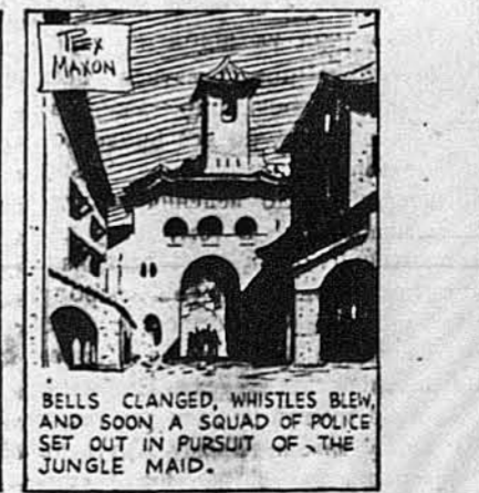
BELLS CLANGED, WHISTLES BLEW, AND SOON A SQUAD OF POLICE SET OUT IN PURSUIT OF THE JUNGLE MAID.

в Женеві. Ця Magna Charta дитини написана у своєрідному патосі міжнародних декларацій: