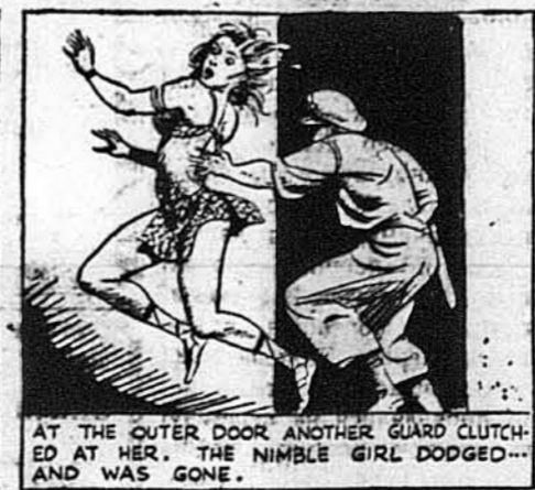
AT THE OUTER DOOR ANOTHER GUARD CLUTCHED AT HER. THE NIMBLE GIRL DODGED... AND WAS GONE.