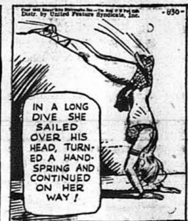
IN A LONG DIVE SHE SAILED OVER HIS HEAD, TURNED A HAND-SPRING AND CONTINUED ON HER WAY!