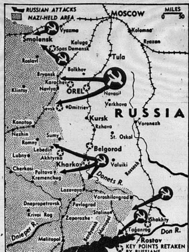
МАПА З СОВЕТСЬКО-НІМЕЦЬКОГО БОЙОВОГО ФРОНТУ. Отсе накреслено місця, з яких советські війська дають наступати на німців, готово в Україні. Це вказується тільки напрям, бо многі міста, що зазначені, що є ще в руках німецьких, є вже по советському боці.

Наше жіноцтво повинно подбати за те, щоб на всякі наші національні свята-роковини, на всякі ширші сходини чи концерти вбирати як не