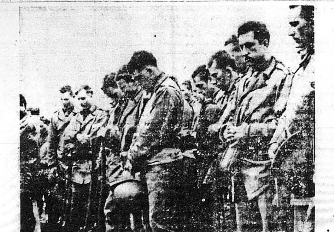
ВІДАЮТЬ ОСТАННЮ ПРИСЛУГУ СВОЇМ ТОВАРИШАМ БОЮ. — Цей Алевтський острів американські вояки віддають останню прислугу своїм товаришам, що полягли в боротьбі за здобуття острова Атту від японців, що відчинили шлях до здобуття Кіска.

ІСТАНБУЛ (Туреччина). — Прибувші з Софії, столиці Болгарії, кажуть, що болгарський король Борис згинув з рук нацистів, що мали його вбити за те, що намагався замиритися з Аліантами. Таку свою думку він виявив перед одним з своїх міністрів. Зараз потім покликано його до головної кватири Гітлера.