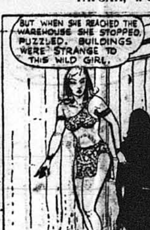
Як вона дійшла до дверей магазину, вона станула здивована.