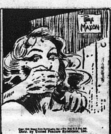
Нагло поза нею двері без шуму відкрилися, і...