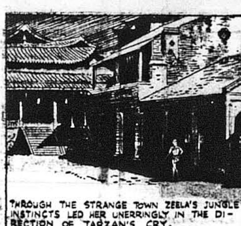
Джунглевий інстинкт вів Зеелу просто в напрямі окрику Тарзана.