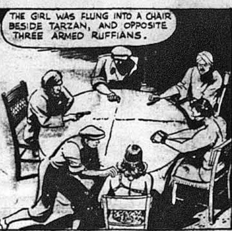
THE GIRL WAS FLUNG INTO A CHAIR BESIDE TARZAN, AND OPPOSITE THREE ARMED RUFFIANS.