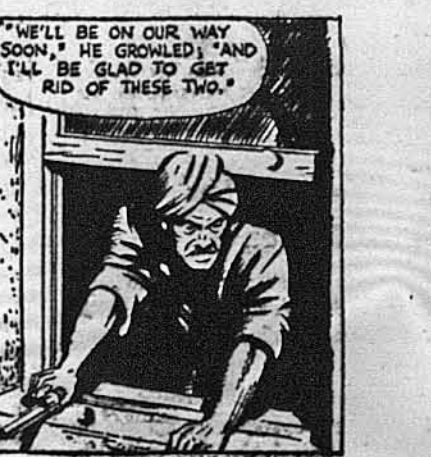
"WE'LL BE ON OUR WAY SOON," HE GROWLED, "AND I'LL BE GLAD TO GET RID OF THESE TWO."

Зіла побачила, що й Тарзанові уста були завязані. Але його очі говорили: „Будь спокійна йне трать сил“.