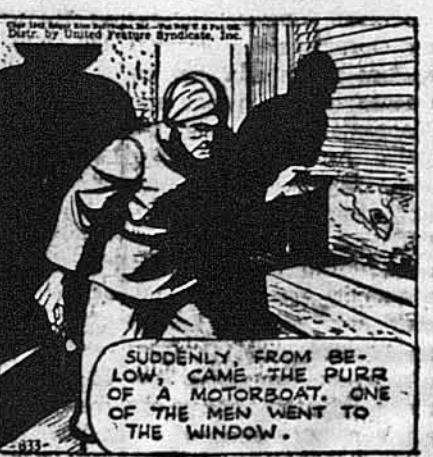
SUDDENLY, FROM BELOW, CAME THE PURR OF A MOTORBOAT. ONE OF THE MEN WENT TO THE WINDOW.