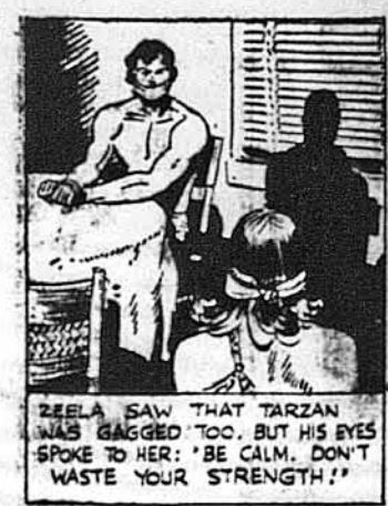
ZEELA SAW THAT TARZAN WAS GAGGED TOO, BUT HIS EYES SPOKE TO HER: "BE CALM, DON'T WASTE YOUR STRENGTH!"