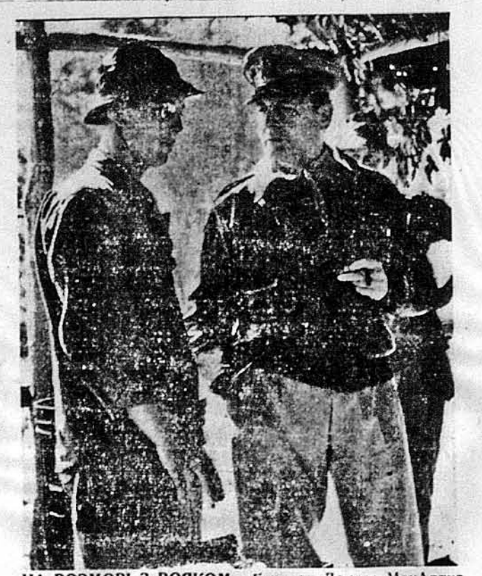
НА РОЗМОВІ З ВОЯКОМ. — Генерал Доллас МекАртур (направо) знаходить час розмовляти не тільки з генералами, але й „простими“. Світлина показує його на розмові з вояком, що перешагав.

є оці „нотари свободи“ з котрих так носить Рузвельт — Кент. У своїй промові після конференції в Квебеку Рузвельт сказав, що він буде навряд гніватися на того, хто не прийме засад чотирьох свобод: іх гонять на поле боїв бажання — діставати новини про війну. Згадав статтю в „Едітор енд Публішер“ подає також, що згадав вище кореспондентів й кореспондентки представили на різних фронтах 13 газет, 6 телеграфічних агенцій, 4 журнали, 6 фільмових і фотографічних агенцій і три радіо зв'язки. Вислані ними телефоном, телеграфом і по радіо звідолення досягають кілька мільйонів слів кожного тижня. Від них ми знаємо, як іде війна. Загальна Рада — ФЛС. В КОЖНІЙ УКРАЇНСЬКІЙ ХАТІ ПОВИНЕН ЗНАХОДИТИСЯ ЧАСОПИС „СВОБОДА“