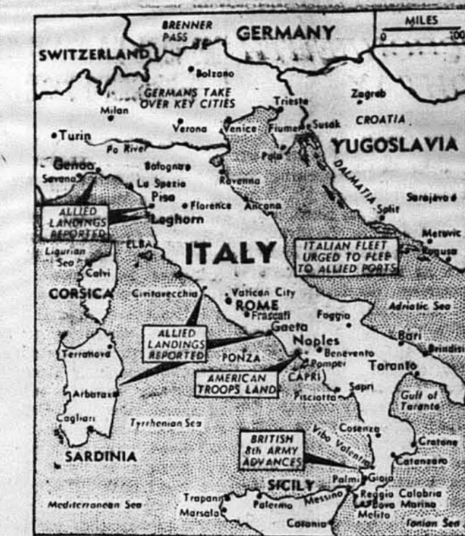
СИТУАЦІЯ В ІТАЛІЇ. Карта Італії показує, де альянти займають в Італії позиції.

Чомуж це так? Чому ми зранку вищі? Людське тіло держиться в доземній, простій позиції завдяки хребтові і м'язам. Але хребет не є одноцілою кісткою: тоді ми не моглиб згинати тулова. Хребет складається з ряду малих хребтових кісток, злучених з собою вязаннями. Якби ті кістки лежали безпосередньо одна на другій