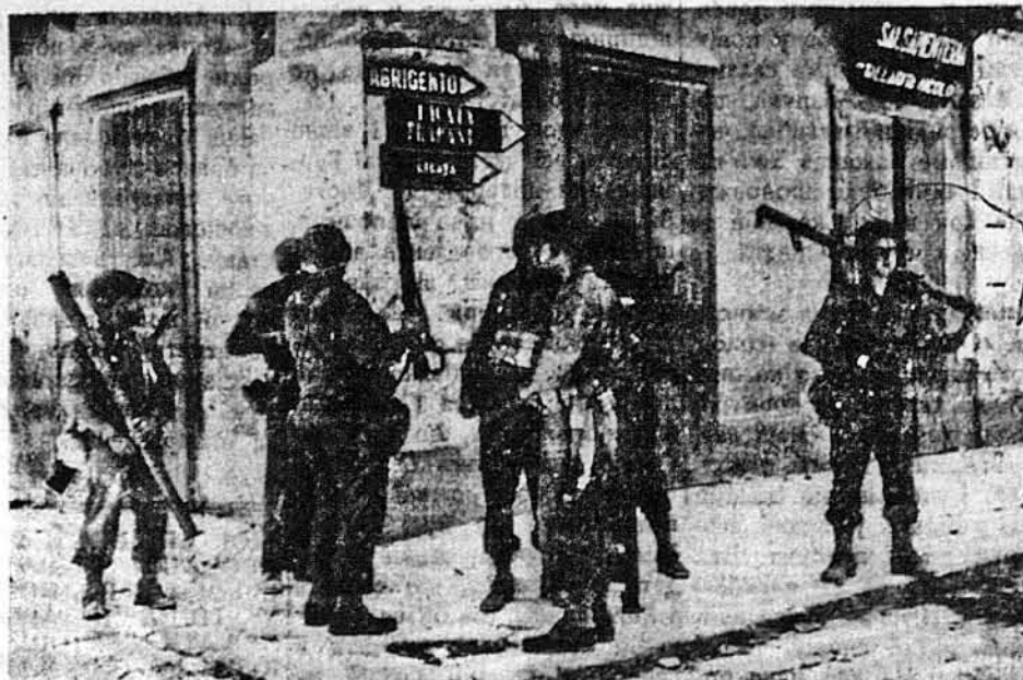
АМЕРИКАНСЬКІ ВОЯКИ З „БАЗУКАМИ“. Американські вояки, прочистивши вулицю сицилійського містечка від ворога, зійшлися з різних вулиць на гутірку. Бачимо, що вони мають „базуки“, себто газівниці, що випускають ракети. Це дуже успішна зброя.

Предсідником Союзу став генерал фон Сейдліц, що командував 51-им німецьким корпусом під Сталінградом. „Режим Гітлера“, каже залик генералів, „нездатний станути на одинокую дорогу, що веде до миру“. Генерали кажуть, що незадовго можуть покинути Німеччину Мадярщина, Румунія й Фінляндія, а тоді Німеччина буде мусити війну програти.