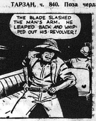
Вістрія розрізало руку старожа ножем, що його держав у звязаних руках.