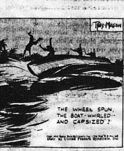
Колесо керми повернулося й човен вивернувся.