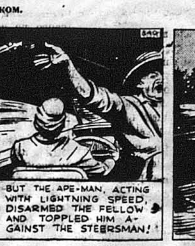
Але Тарзан блискавично його розбров і трутив його на моторового.