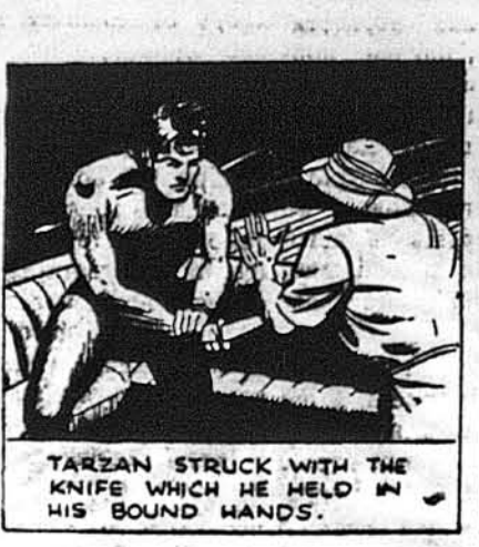
TARZAN STRUCK WITH THE KNIFE WHICH HE HELD IN HIS BOUND HANDS.

ВЕТРО ВРЕМЯ УКРАЇНСЬКІЙ ПОГРЕБНИК Занимаєсь похоронами в БРОУК, БРОУКЛІН, НЬЮ-ІОРК І ОКОЛИЦІХ 129 EAST 7th STREET, NEW YORK, N. Y. Tel.: ORchard 4-2568 BRANCH OFFICE & CHAPEL, 707 Prospect Avenue, (cor. E. 165 St.), BRONX, N. Y. Tel.: MEtrose 5-5877