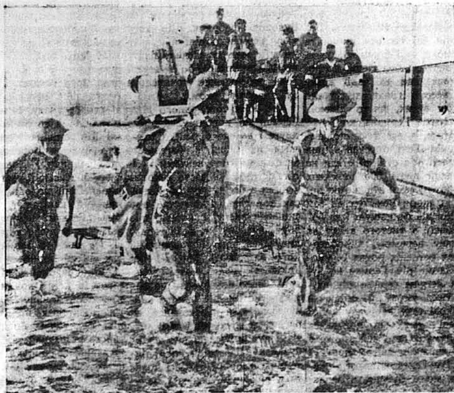
ИНВАЗИЯ НЕ ОБИШЛАСЬ БЕЗ ЖЕРТВ. — Отсе бачимо одну з причин, чому треба нам закуповувати бонди Третьої Воєнної Позички. Наші вояки виносять на беріг свого товариша, що віддав усе найкраще й найдорожче за ідеали Америки.

Напруження відносин між Німеччиною й Ватиканом далі збільшується. Німецькі війська арештували двох кардиналів, як вони входили з Риму на територію Ватикану, і задержали їх для допитів. Папа від двох тижнів відмовляється прийняти генерала Кессельрінга, як довго німецькі війська окупуєть хочби частину Ватикану.