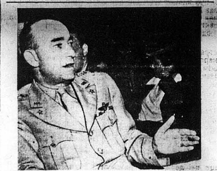
БАТЬКИ ТАКИ МУСЯТЬ ІТИ ДО ВІПСЬКА! —Таке заявив Сенатському Комітетові для Військових справ ген. Джозеф Т. Мекларней. Казав, що стратегія, вирішена підчас Квебекської Конференції, вимагає такого військового побору.