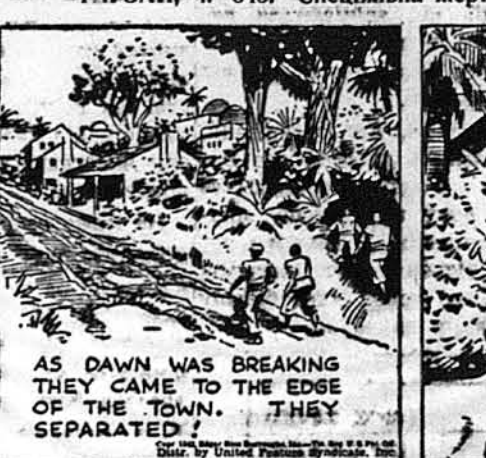
Як розвиднювалося, вони прибули на край місточка. Банда розділилася.