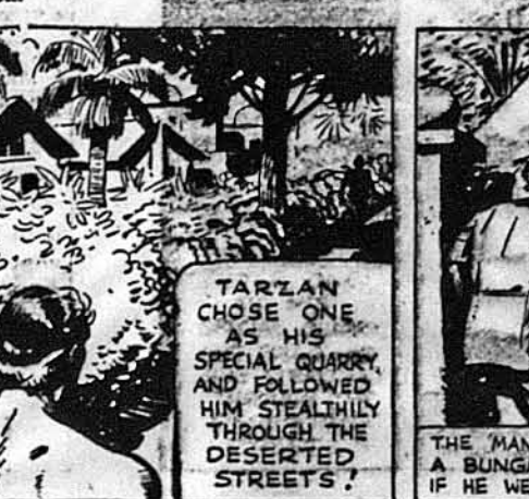
Тарзан вибрав собі одного з них як свою спеціальну жертву і пішов крадьком за ним опущеними вулицями.