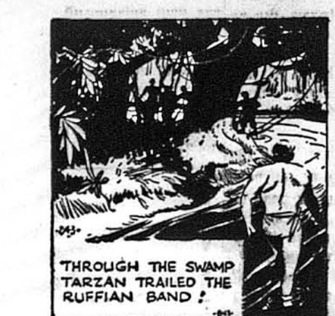
Через болота Тарзан слідив за бандою опришків.