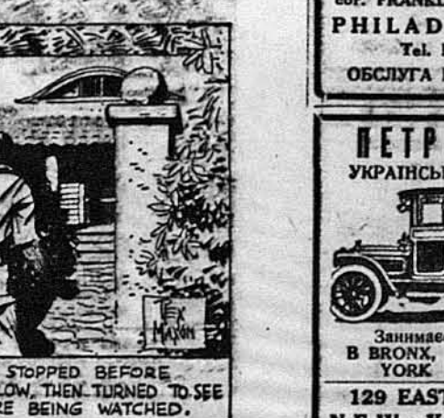
Чоловік задержався перед одним домом, повернувся й оглянувся, чи хто його не слідить.