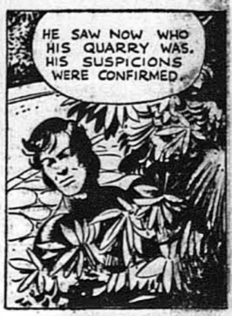
Він бачив тепер, за ким він ішов. Його підозріння були потверджені.