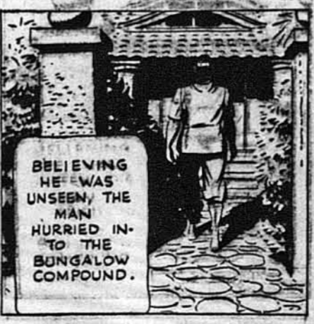
Певний, що за ним ніхто не глядає, чоловік поспішно пішов до хати.