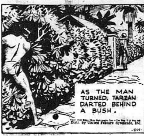
Як чоловік обернувся, Тарзан скочив поза корч.