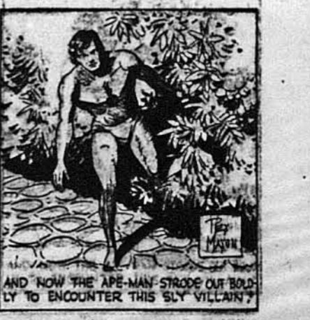
Тепер Тарзан пішов скорим ходом за хитрим бандитом.