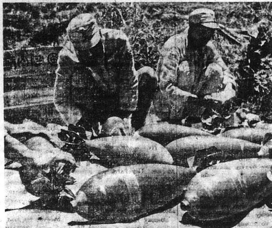
ВІЛАДОВУЮТЬ ЗНАРЯДДА ДЛЯ НАЛЕТІВ НА ЯПОНЦІВ. — Отсі бомби, що їх маємо перед собою, виладовують китайці з тріків, щоб їх приготувити для літаків, що мають бомбардувати японські позиції в горах. Це американська амуніція.

ВАШИНГТОН. — Сенатор Джозеф Г. Бол написав для пресової агенції Юнайтед Прес свої погляди на становище сенату в справі закордонної політики Америки. Він стверджує, що напрям післявоєнної американської заграничної політики залежить від сенату. Але сенат мусить сказати своє слово вже тепер, заки Америка піде на міжнародне форум.