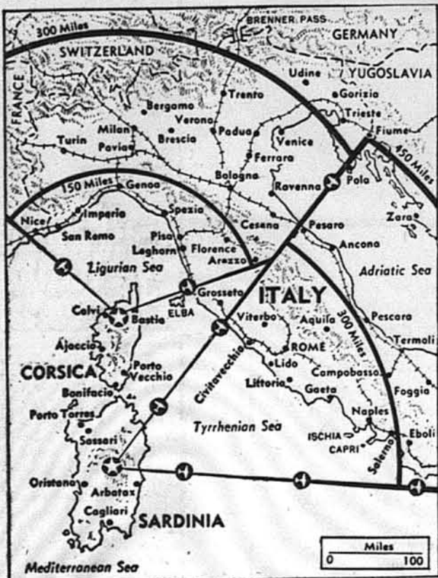
ЗНАЧИННЯ ДОБУТТЯ САРДИНІЇ І КОРСИКИ ДЛЯ АЛІАНТІВ.—Карта показує, чому острови Сардинія й Корсика, що положені в північно-західній частині Середземного моря, важні для Аліантів. З летунських майданів на тих островах можна бомбардувати легко, бо протягом одної години по вилеті, навіть Бренерський провал, „брату до Німеччини“.