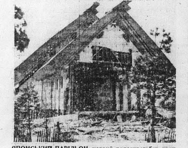
Японський павільон, котрий подарував був японський уряд на світову виставу в Нью Йорку, а котрий думали задержати як частину парку, почато недавно розбирати на домагання громадянства.