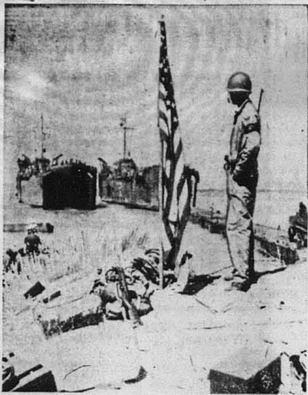
АМЕРИКАНСЬКИЙ ПРАПОР НА СИЦИЛІЇ.—Американський прапор заткнуто на горбі коло Сколітті, на Сицилії, де висіли на беріг американські війська.