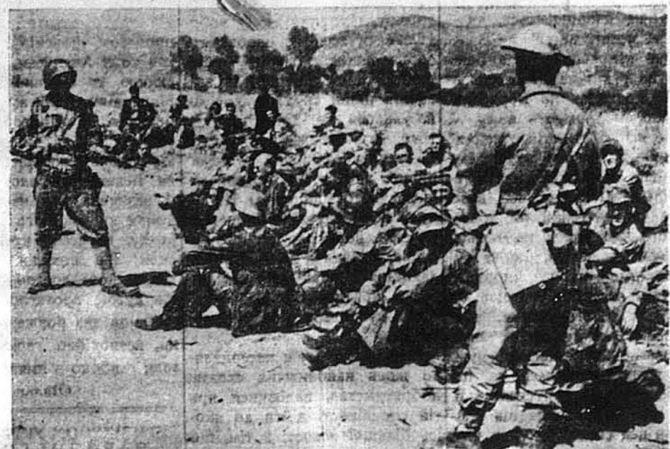
ТЕ, ТО ВОНИ ВЖЕ ДОВРЕ РОЗУМІЮТЬ. — Це сидять німецькі вояки, взяті в полон біля Салерно в Італії. Вони не розуміють альянтських вояків, що їх сторожать з витягненими крісами, ні альянтські вояки не знають німецької мови. Та проте полонені добре розуміють, що означає кріс, готовий до вистрілу.

Бритійські урядові круги висказують неофіційно своє розчарування сприводу публичних заяв п'яти американських сенаторів по повороті з подорожі по світі. Їх огриче спеціально розкриття різниць між Америкою й Британією тепер, коли війні ще далеко до кінця й коли в Москві збирається конференція Америки, Британії й Росії. Деякі з британських урядовців добачують у цих виступах бажання Америки знову відмовитися від участі в міждержавній організації мира. Бритійський журнал „Економіст“ осуджує „недавній вибух економічного націоналізму Злучених Держав“.